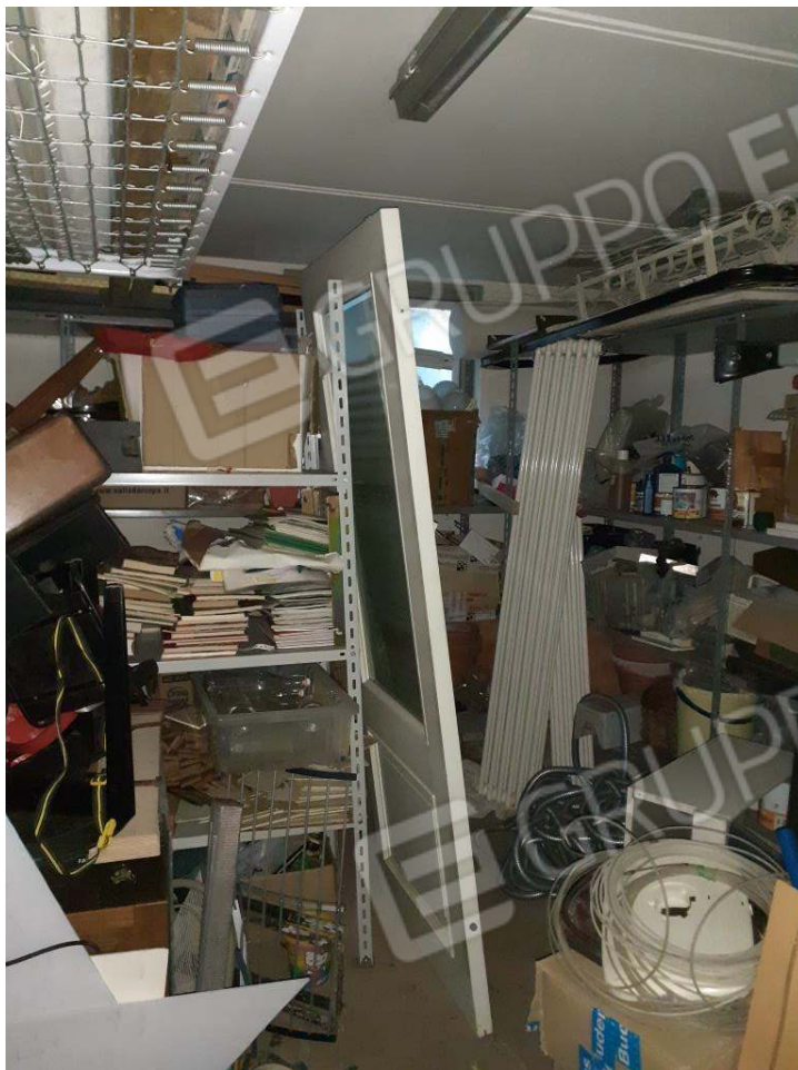
U.I. SUB 18 – INTERNO