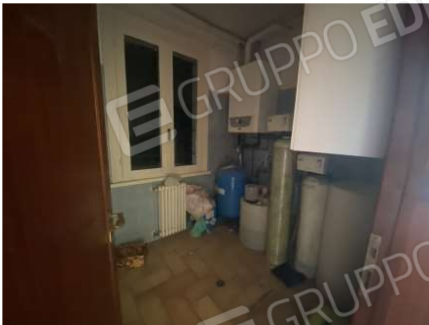
Interno piano terra unità abitativa sub 2 – bagno pt non realizzato