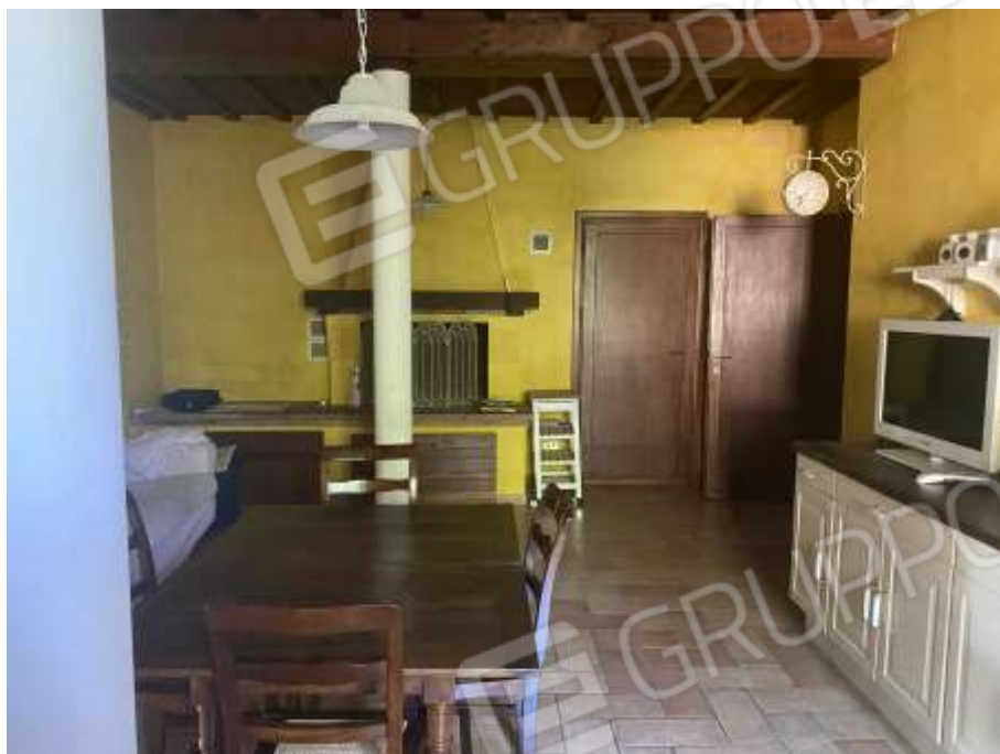
Interno piano terra unità abitativa sub 2 – scala