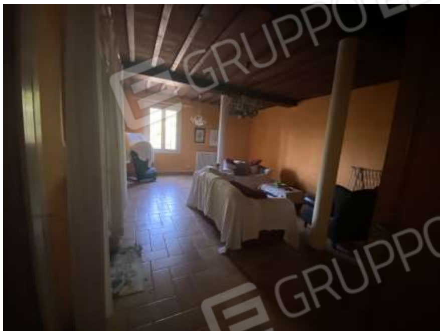
Interno piano terra unità abitativa sub 2 – cucina