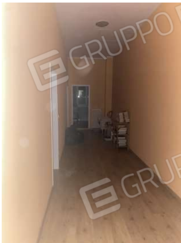
Interno piano primo unità abitativa sub 2 – corridoio con porta verso unità sub 1