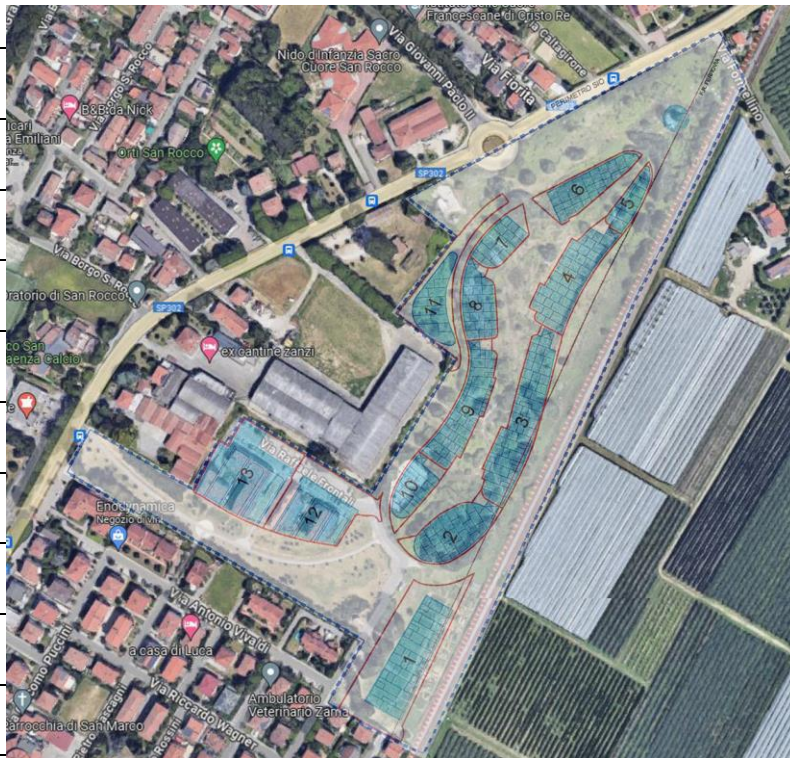
Vista aerea con evidenziata l'area denominata “Il Quartiere San Rocco”

del RUE vigente “Obiettivi di qualità - Prestazioni minime nel centro urbano”.