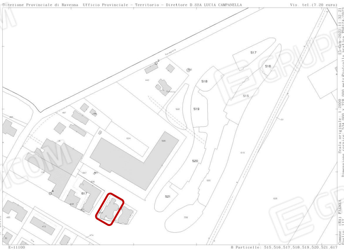
Foto 2: Estratto di mappa – Fabbricato A, foglio 117, mappale 616