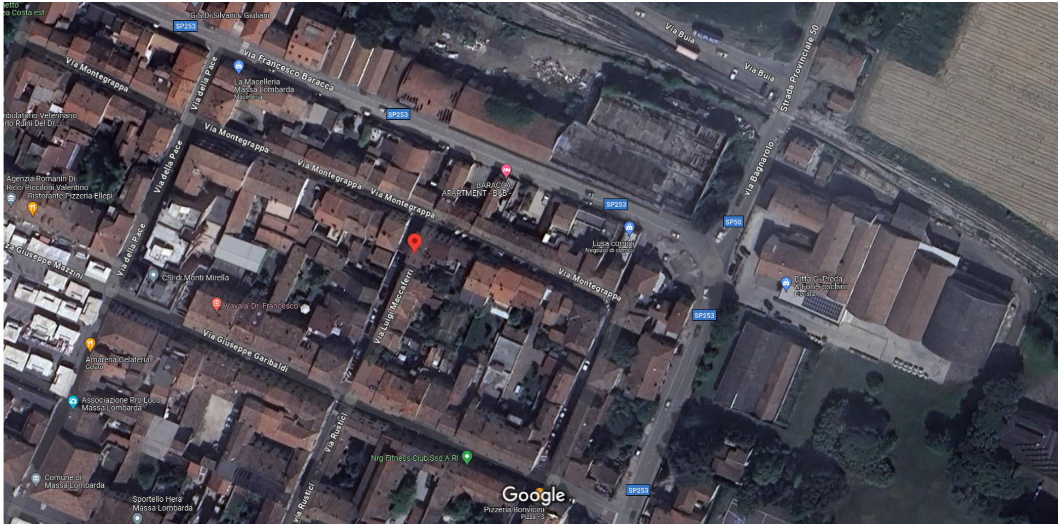
Immagini ©2024 Airbus,Maxar Technologies,Dati cartografici ©2024 20 m