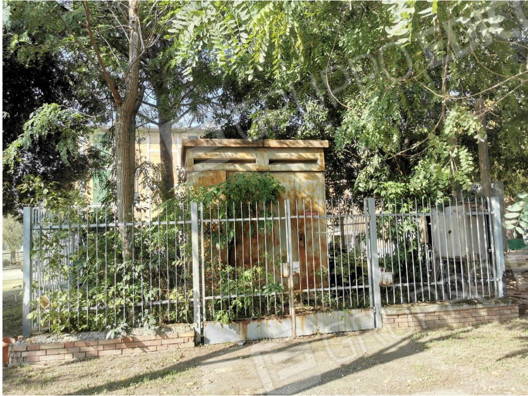
Ex Cabina elettrica - mappale 352