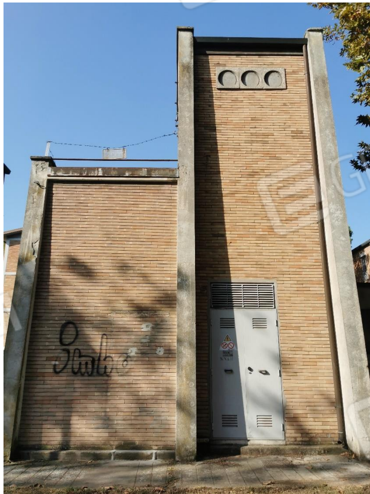
Cabina elettrica - mappale 153 sub 1