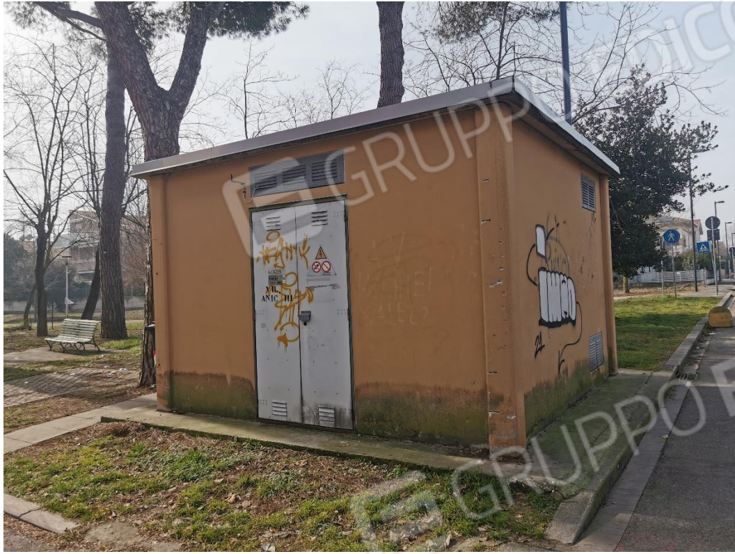
Cabina elettrica - mappale 350