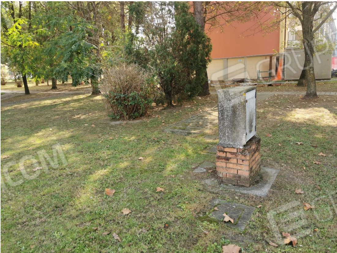
Area su cui insisteva la cabina elettrica - mappale 353