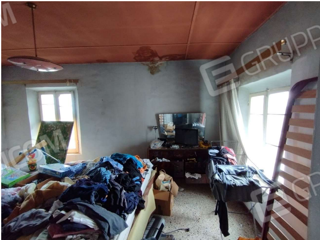
Camera da letto – Piano primo