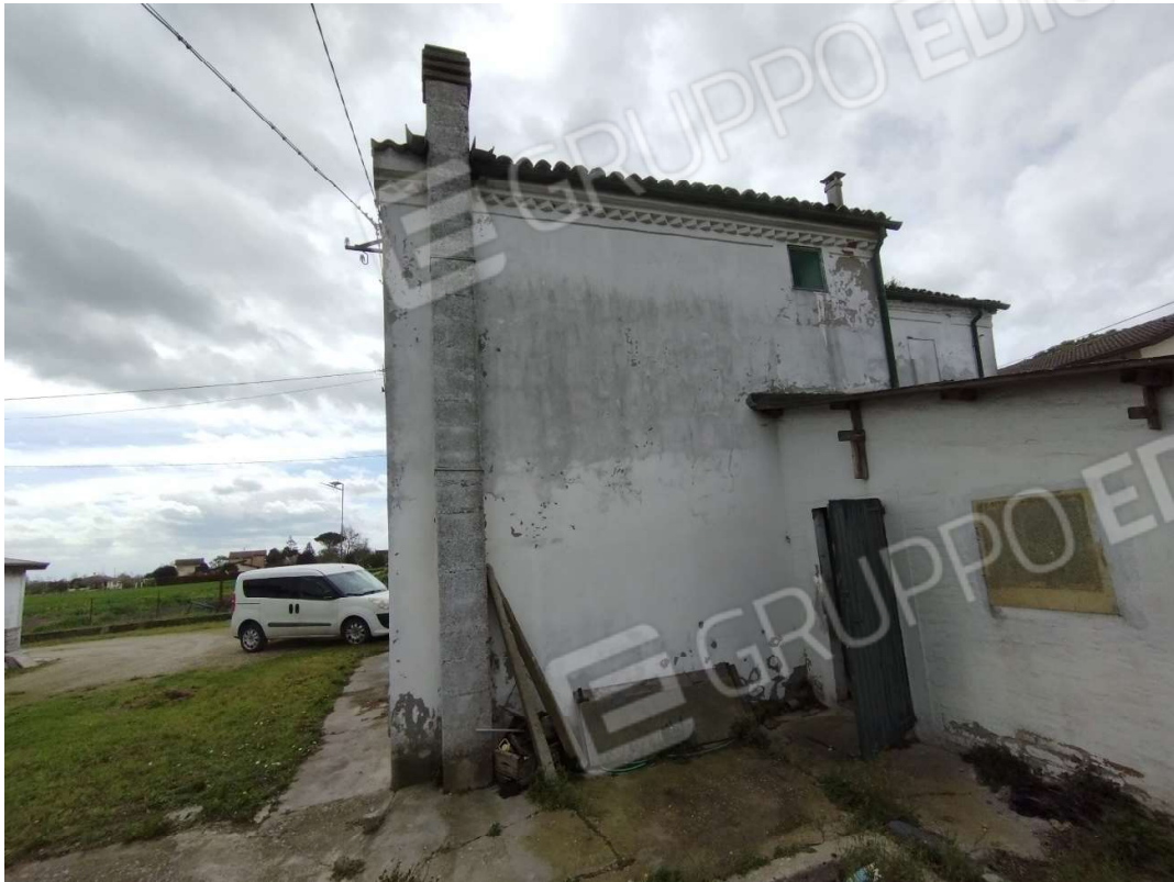
Vista del fronte nord della abitazione