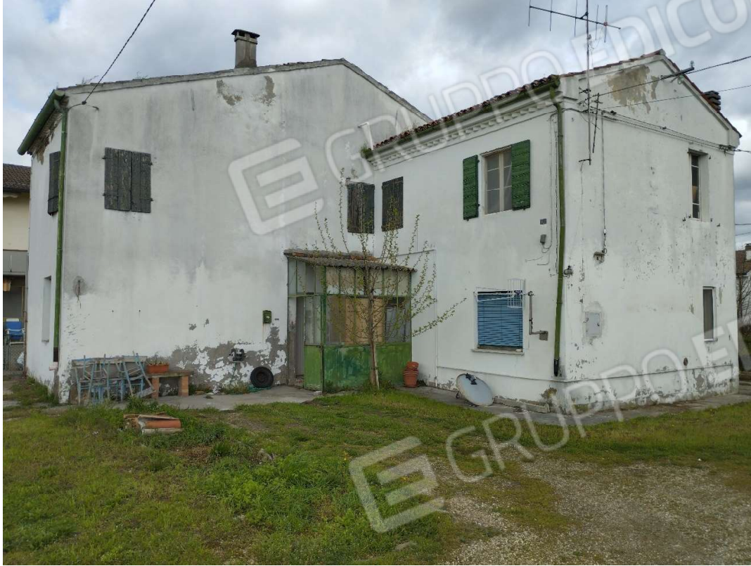
Vista del fronte della abitazione – prospetto est