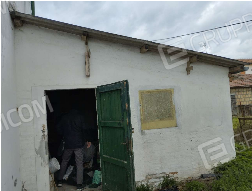
Vista del fronte est dei servizi adiacenti all'abitazione