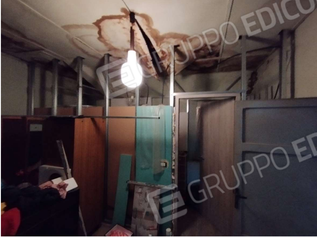
Camera – Piano primo