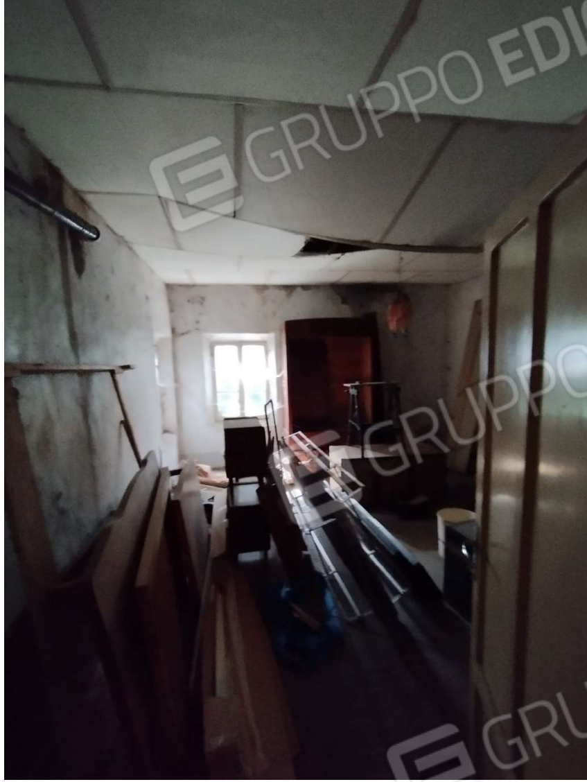
Camera – Piano primo