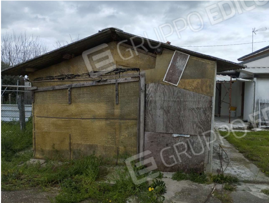
Vista del fronte ovest dei servizi esterni