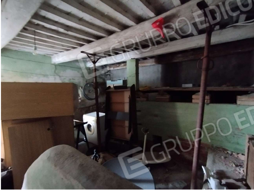
Servizi interni all'abitazione – Piano terra