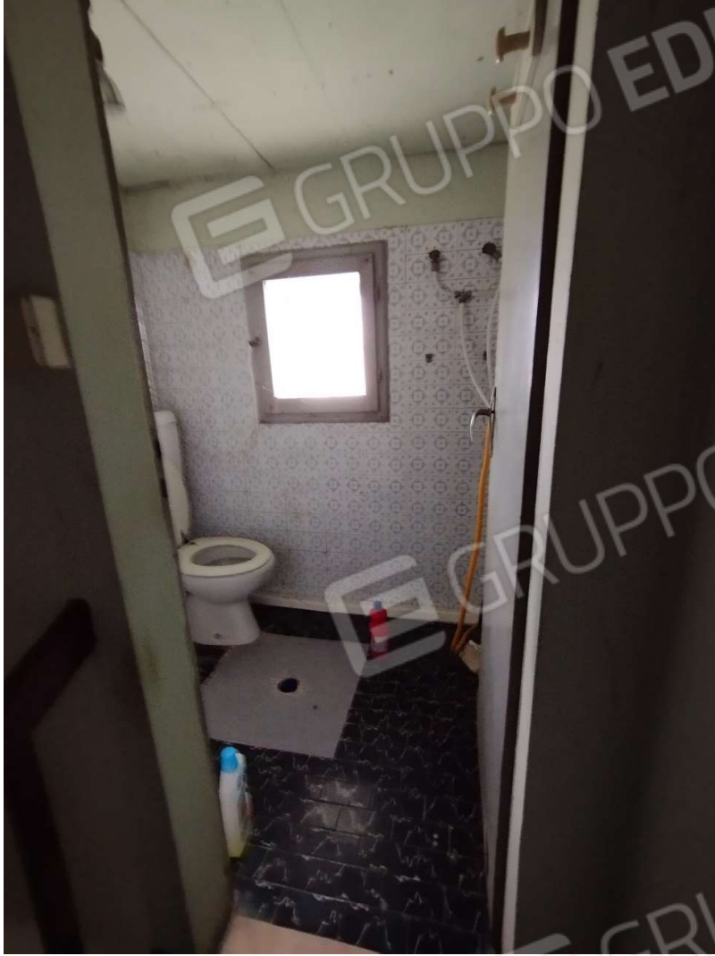
Interno bagno sul vano scala – Piano primo