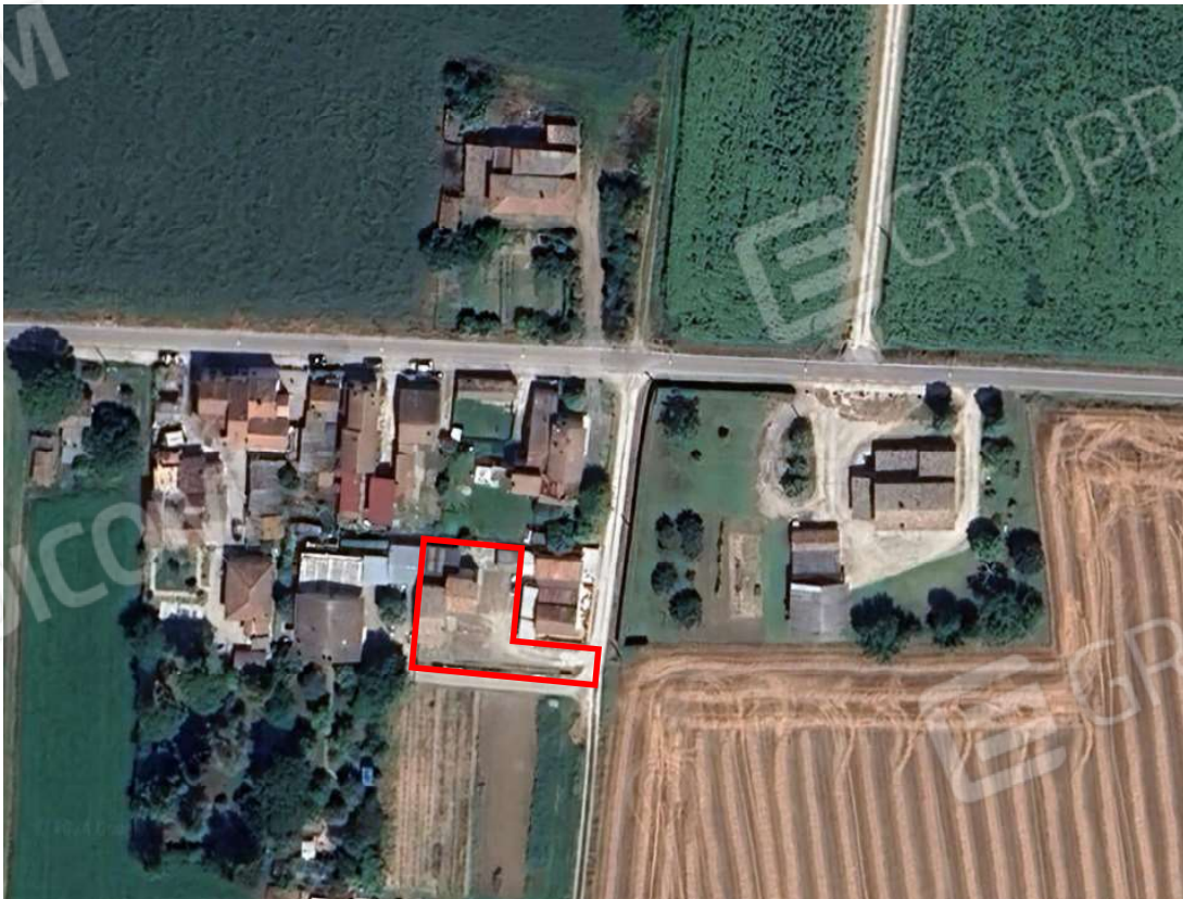
Vista satellitare con perimetrazione area di interesse