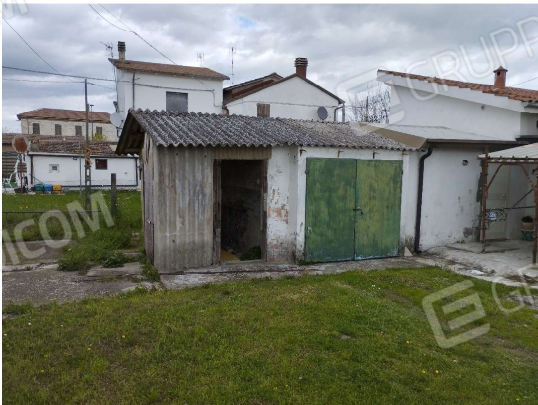
Vista del fronte sud dei servizi esterni