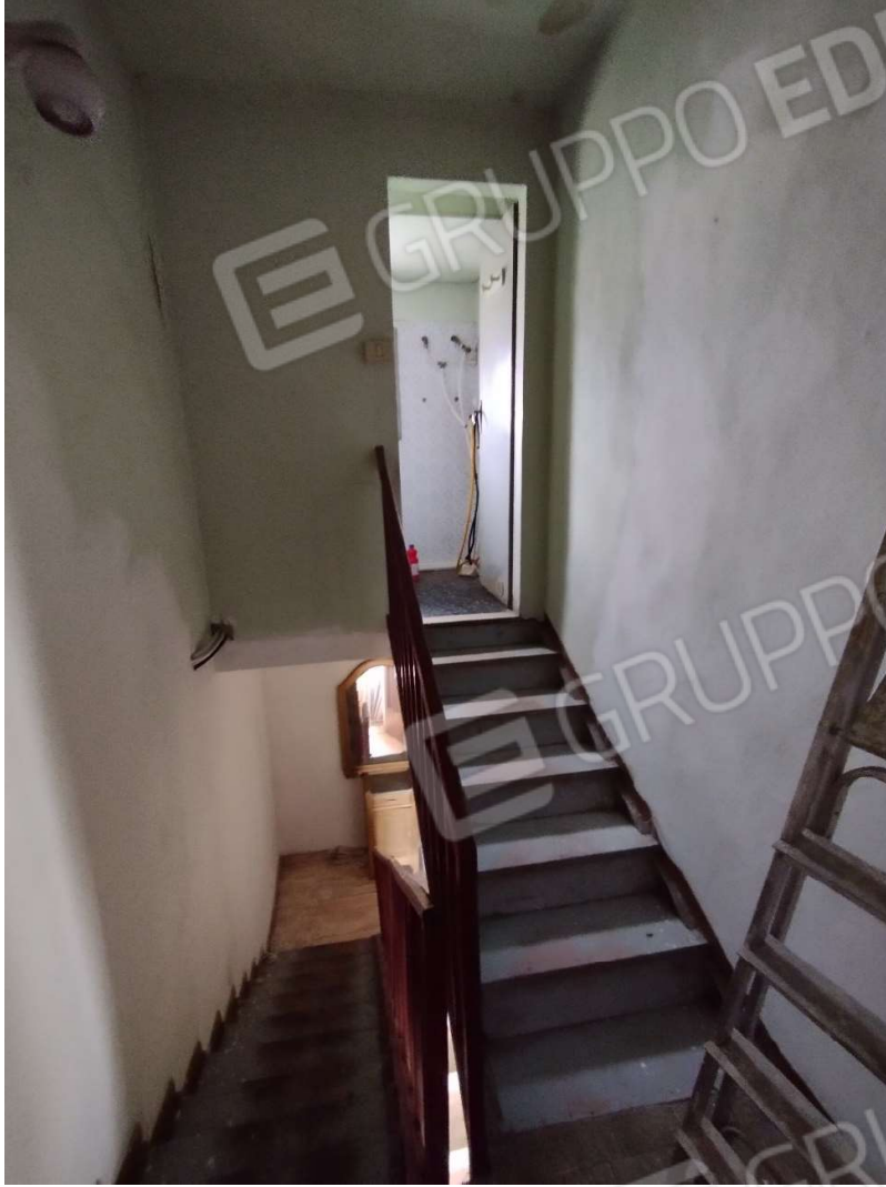
Scala che conduce al bagno – Piano primo