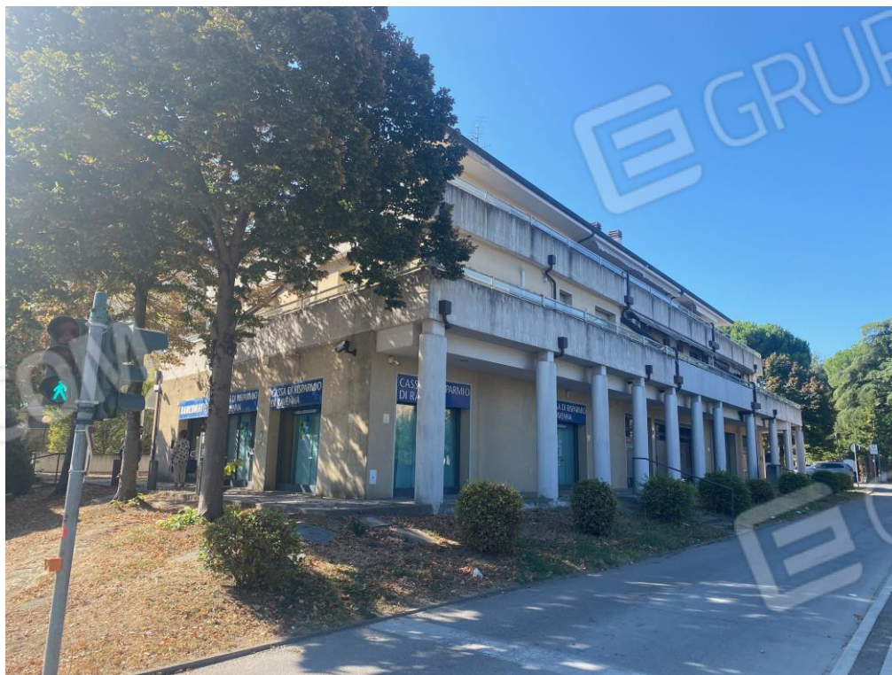
Foto 2 edificio condominiale su via Malta