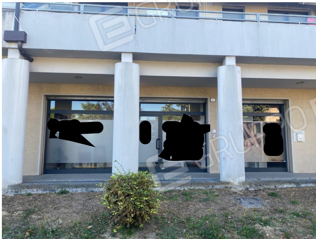
Foto 1 fronte edificio