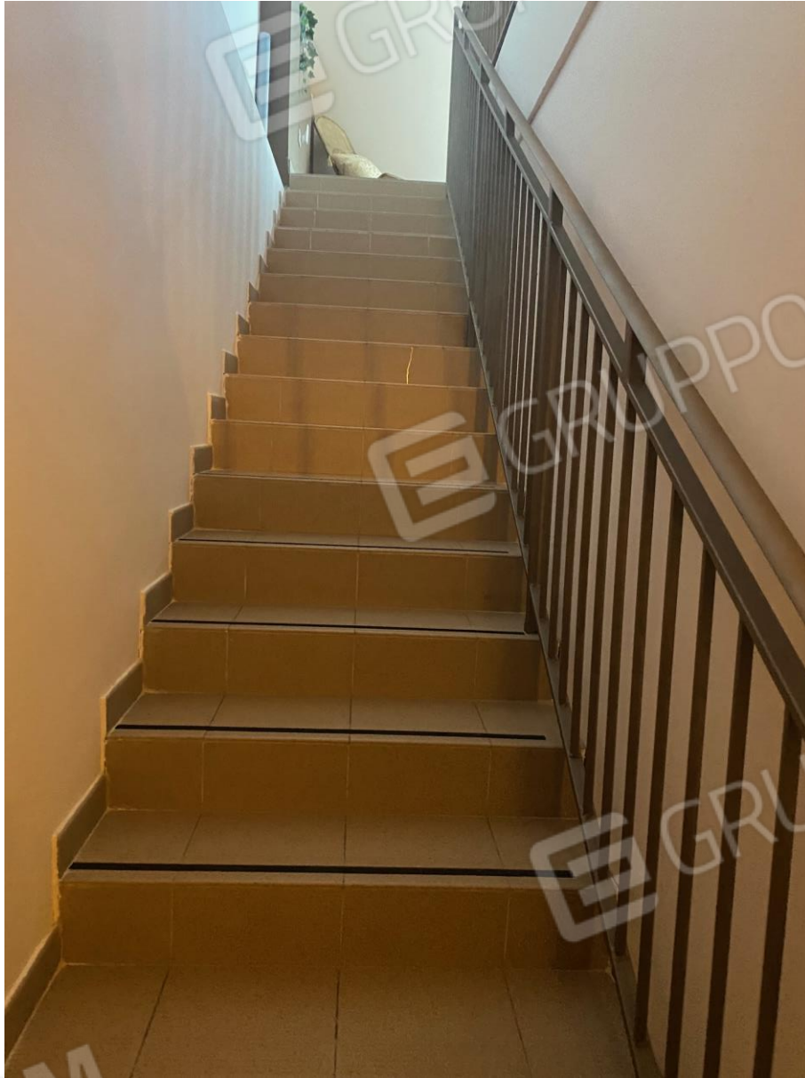
Foto 6 scala di collegamento al deposito piano interrato

Via M. D'Azeglio 38 48121 Ravenna www.stefanofocacciaarchitetti.it T +390544215210 F +390544246754 M. info@stefanofocacciaarchitetti.it C.F. FCCSFN66S10C553W P.I.V.A. 00599440393