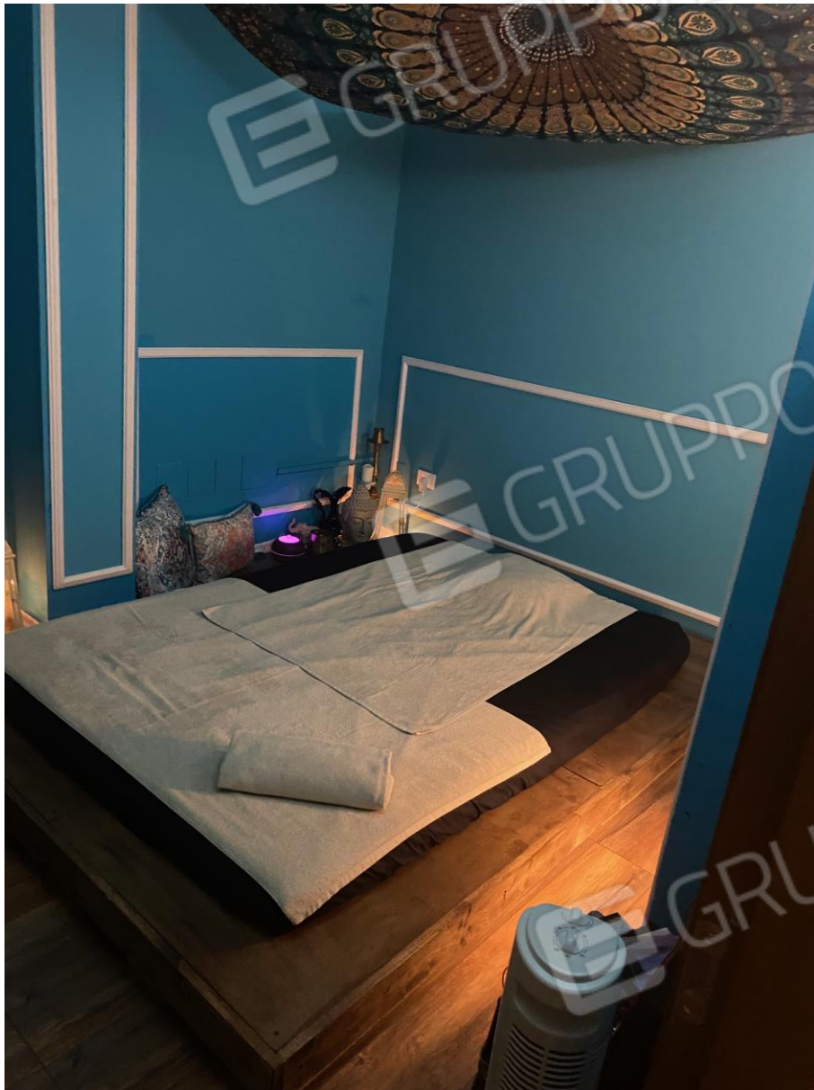
Foto 7 deposito piano interrato trasformato in laboratorio

Via M. D'Azeglio 38 48121 Ravenna www.stefanofocacciaarchitetti.it T +390544215210 F +390544246754 M. info@stefanofocacciaarchitetti.it C.F. FCCSFN66S10C553W P.I.V.A. 00599440393