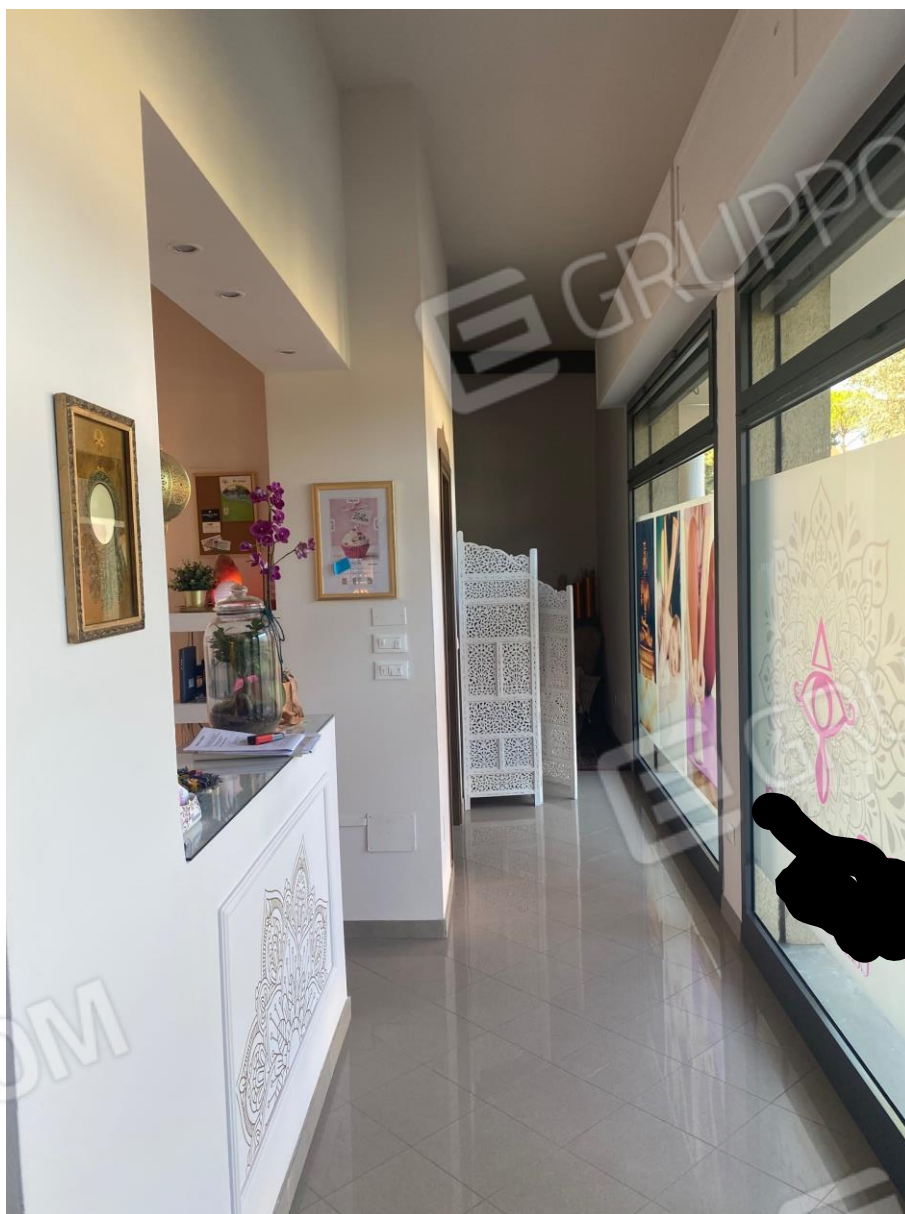
Foto 3 interno laboratorio artigianale laboratorio artigianale uso attuale a centro benessere

Via M. D'Azeglio 38 48121 Ravenna www.stefanofocacciaarchitetti.it T +390544215210 F +390544246754 M. info@stefanofocacciaarchitetti.it C.F. FCCSFN66S10C553W P.I.V.A. 00599440393