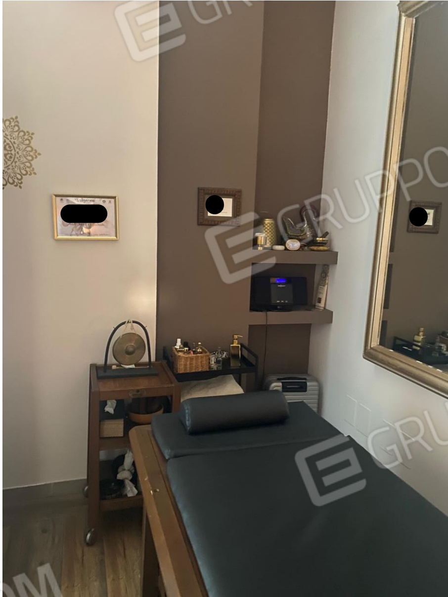
Foto 5 interno laboratorio artigianale

Via M. D'Azeglio 38 48121 Ravenna www.stefanofocacciaarchitetti.it T +390544215210 F +390544246754 M. info@stefanofocacciaarchitetti.it C.F. FCCSFN66S10C553W P.I.V.A. 00599440393