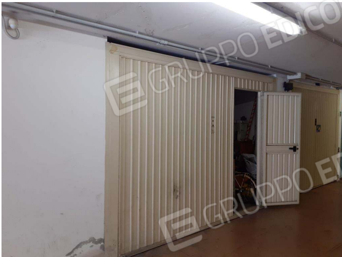
U.I. SUB 18 – PORTONE BASCULANTE DEL GARAGE CON PORTA PEDONALE