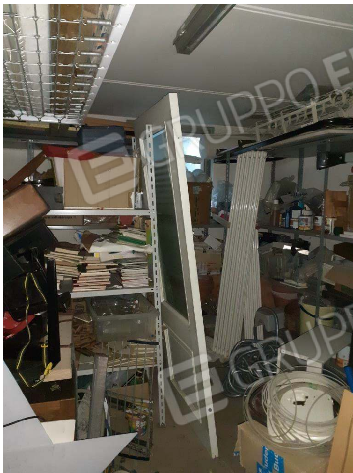
U.I. SUB 18 – INTERNO