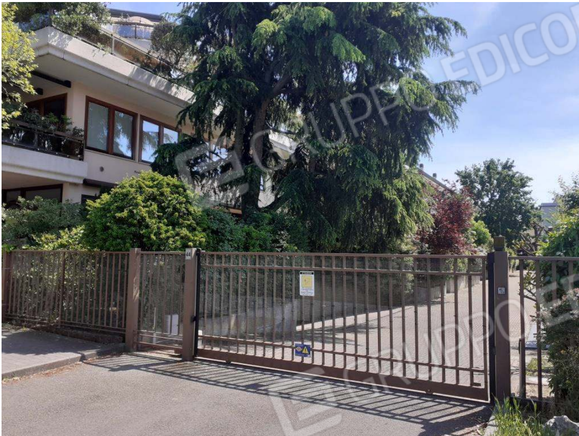
VISTA LATO OVEST DEL FABBRICATO "A" – INGRESSO CARRABILE VIA CILLA N.44 CON CANCELLO MOTORIZZATO