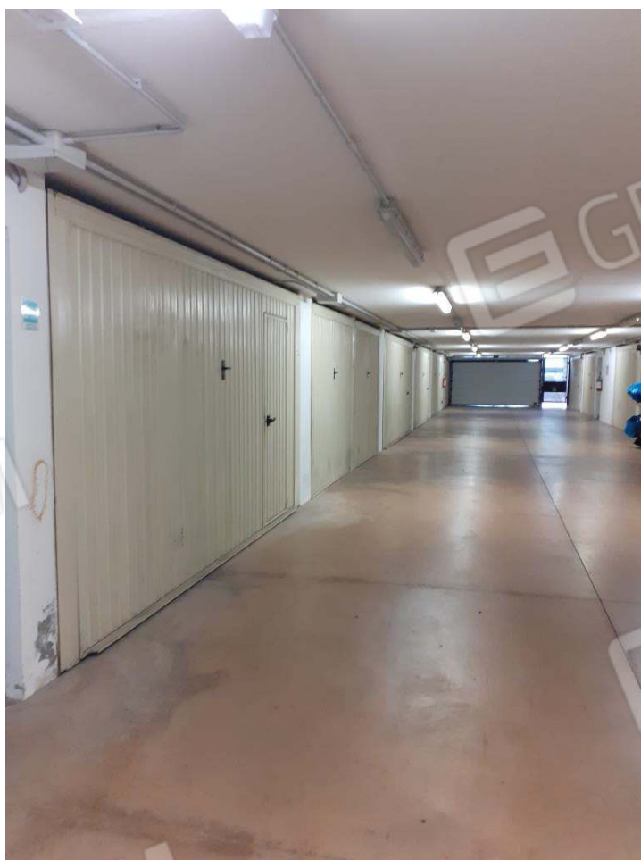
CORSIA CARRABILE ALL'INTERNO DELLA RIMESSA AL PIANO SOTTOSTRADA