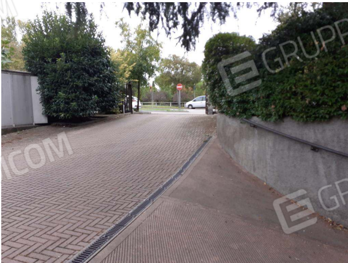
RAMPA DI INGRESSO ALLA RIMESSA INTERRATA