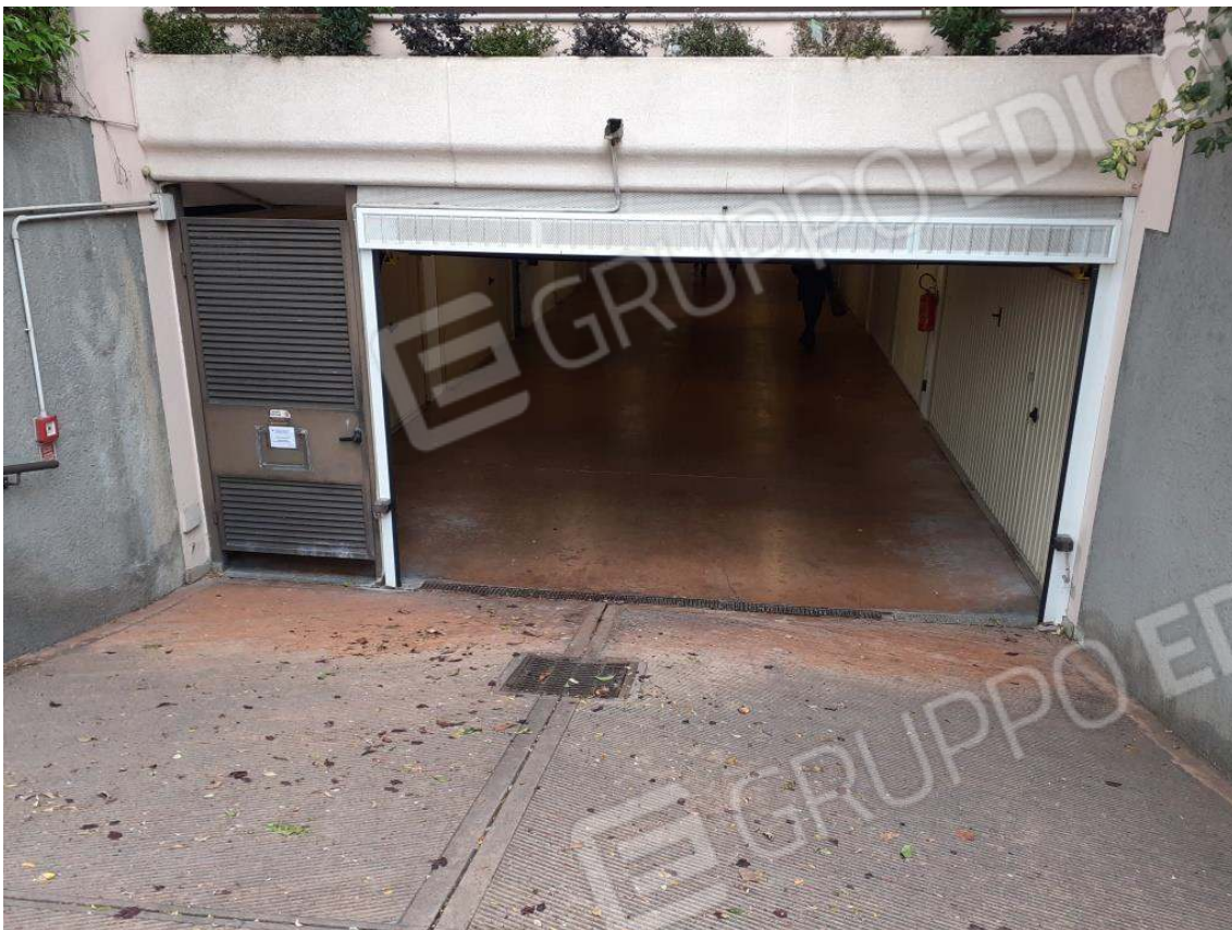
INGRESSO DELLA RIMESSA INTERRATA AL PIANO SOTTOSTRADA