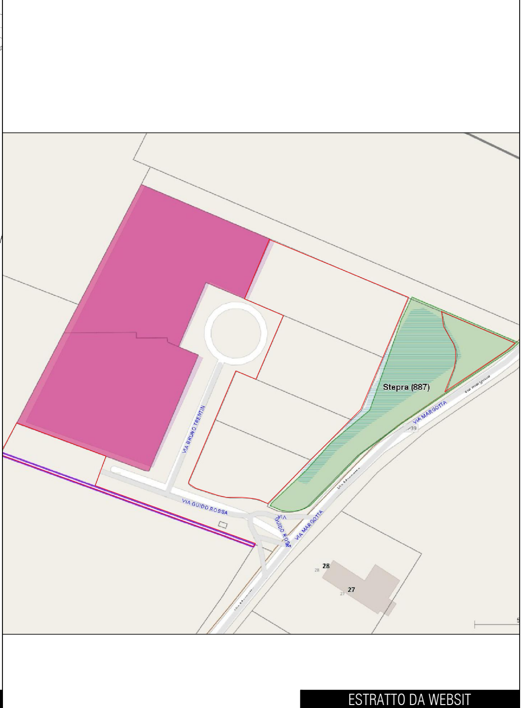
ESTRATTO DA WEBSITE

ING. DAVIDE FUCHI VIA MONTE ADAMELLO, 14 48121 RAVENNA (RA)