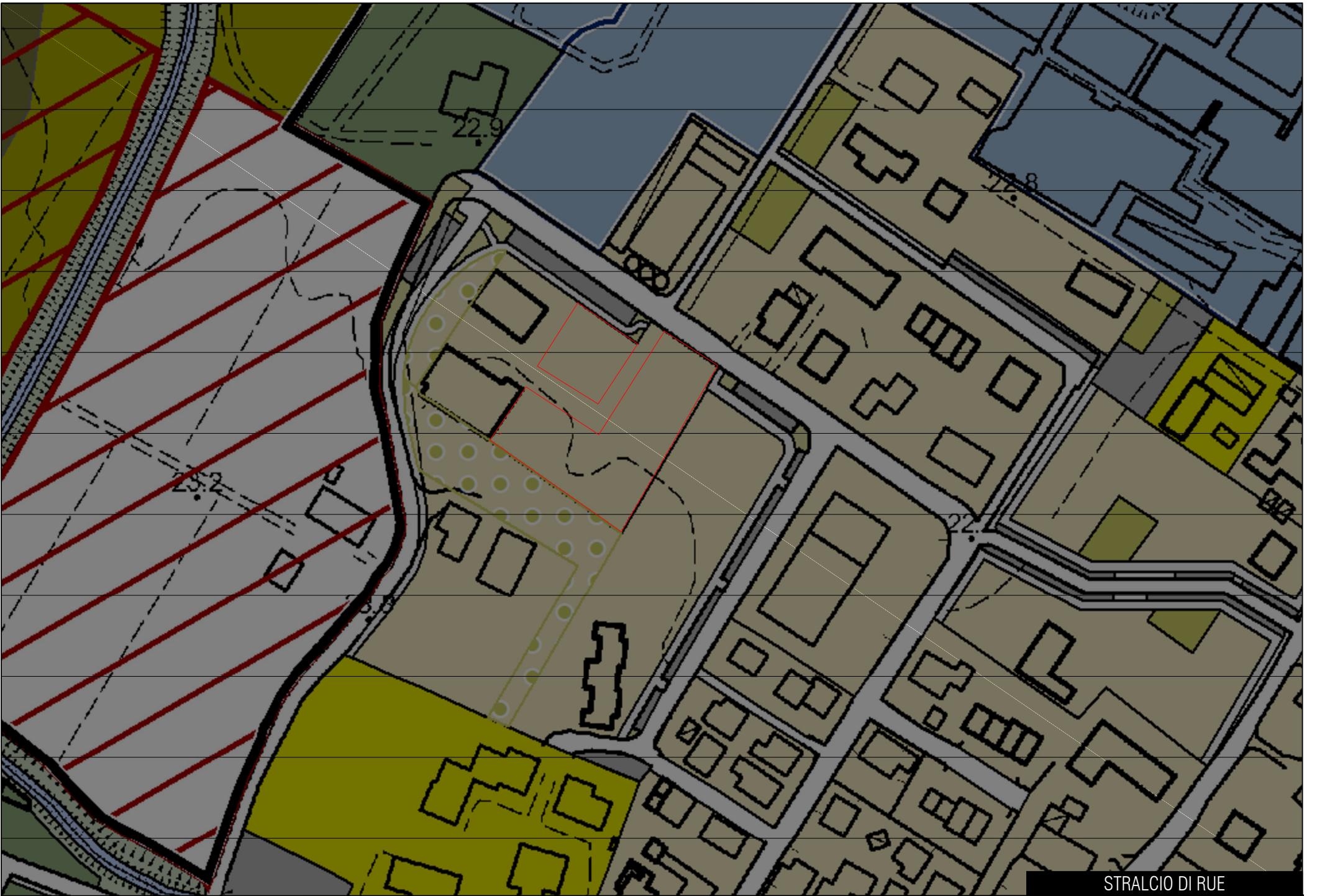
STRALCIO DI RUE