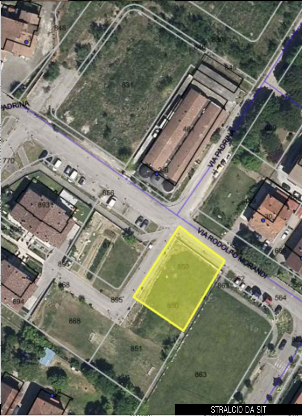
STRALCIO DA SIT