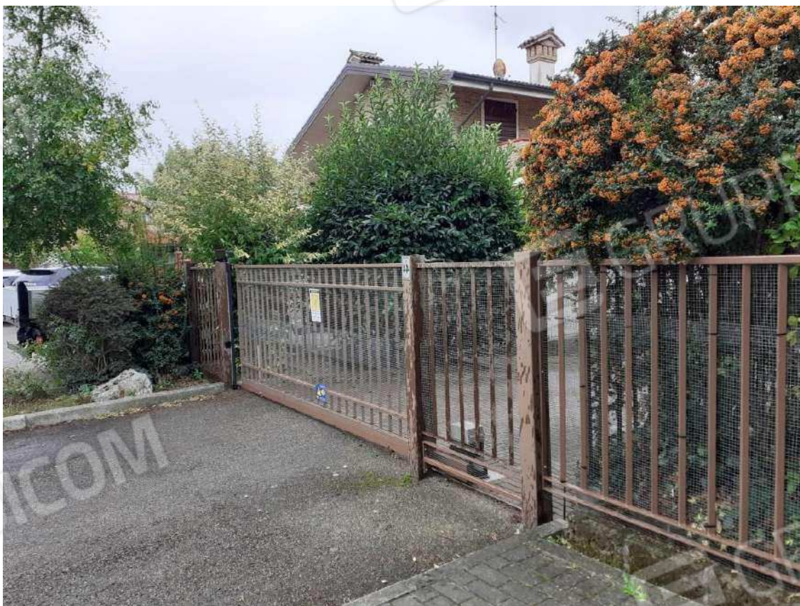
CANCELLO CARRABILE MOTORIZZATO PER L'ACCESSO ALLA RAMPA DI INGRESSO ALLA RIMESSA INTERRATA