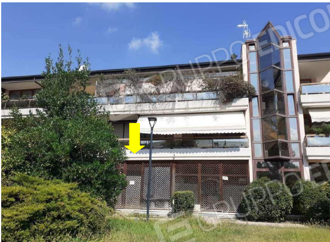
PROSPETTO SUD DEL FABBRICATO – INGRESSO U.I.80 POSTO SUL RETRO