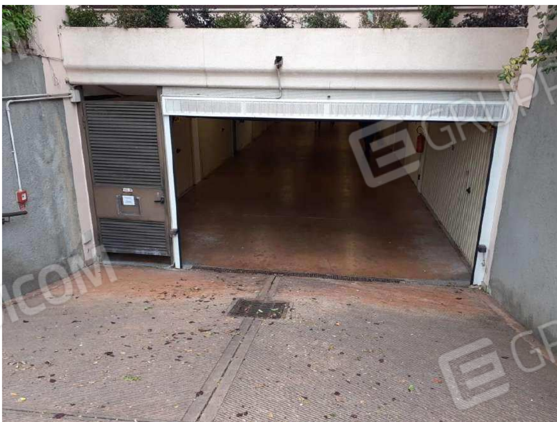
INGRESSO DELLA RIMESSA INTERRATA AL PIANO SOTTOSTRADA