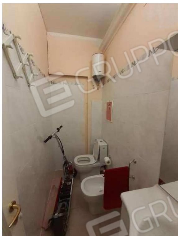
INTERNI SUB 80 - 1° BAGNO REALIZZATO IN ASSENZA DI TITOLO AUTIZZATIVO E NON RAPPRESENTATO NELLA PLANIMETRIA CATASTALE