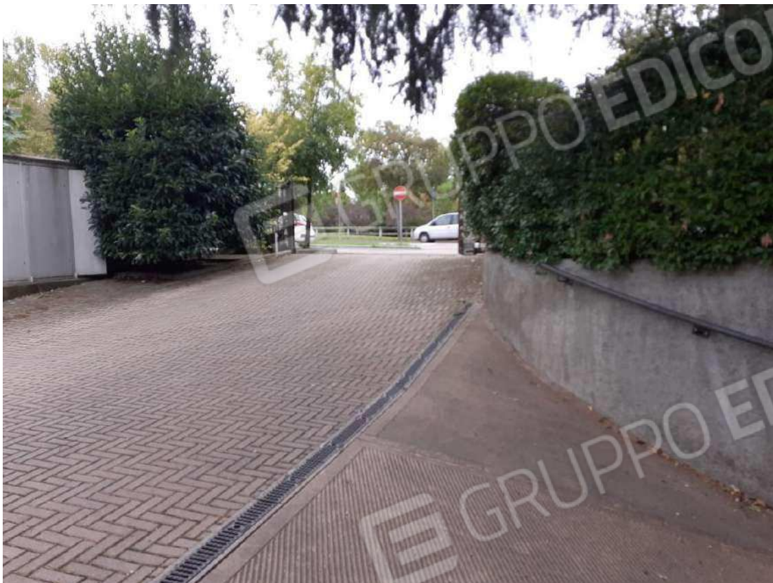
RAMPA DI INGRESSO ALLA RIMESSA INTERRATA