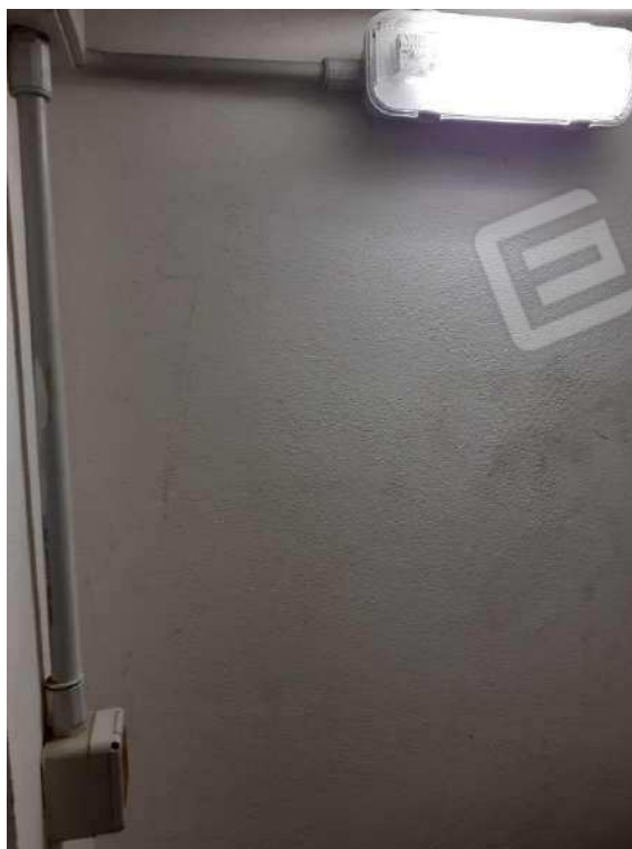
PARTICOLARE IMPIANTO ELETTRICO DELLA CANTINETTA SUB 141