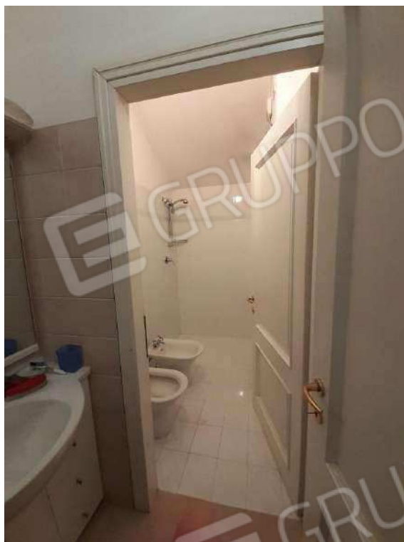
INTERNI SUB 80 - 2° BAGNO