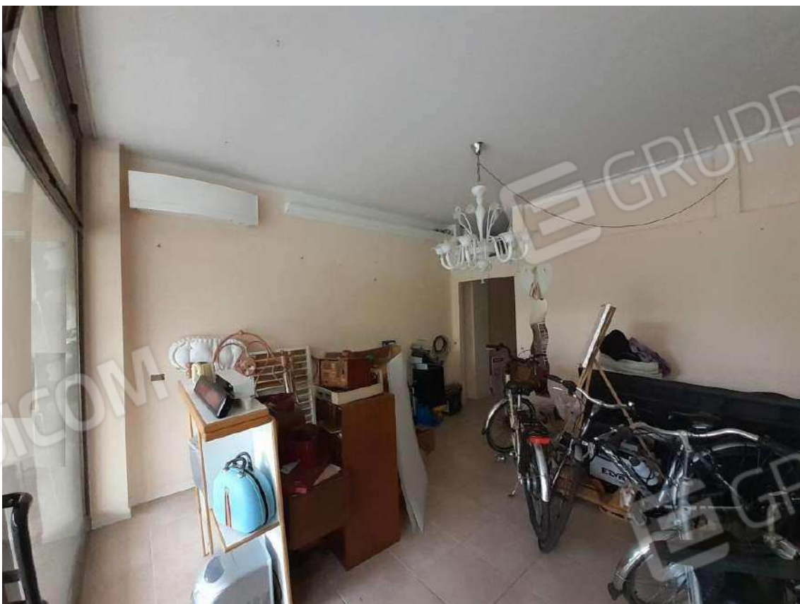
INTERNI SUB 80