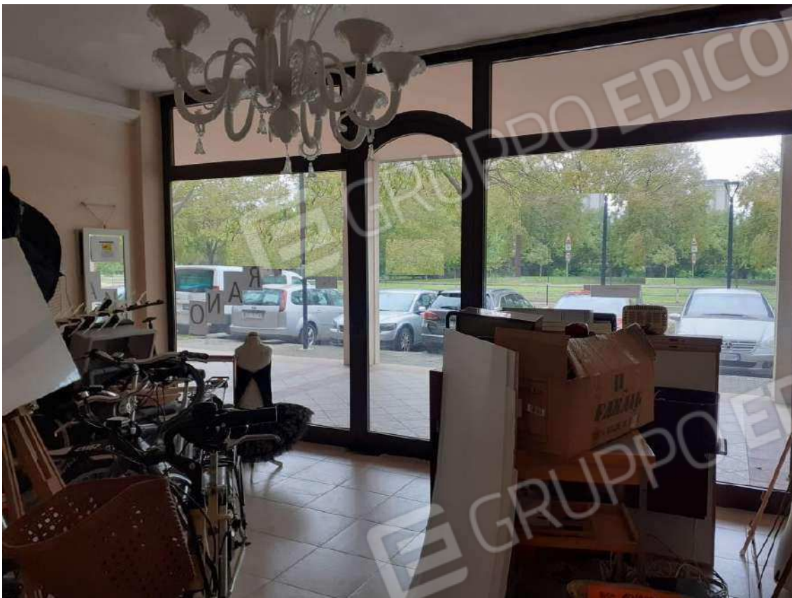
INTERNI SUB 80