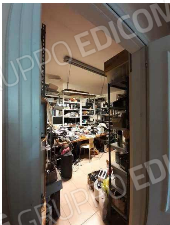
INTERNI SUB 80