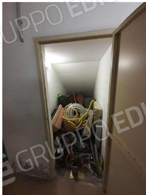
SUB 141 - CANTINETTA - RIMESSA INTERRATA