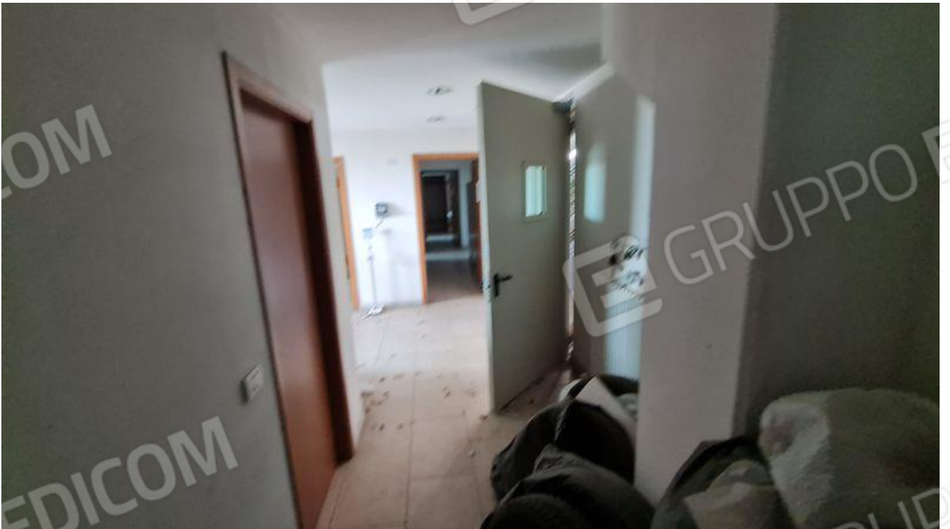
Disimpegno con vista su porta per accesso a scala (PT)