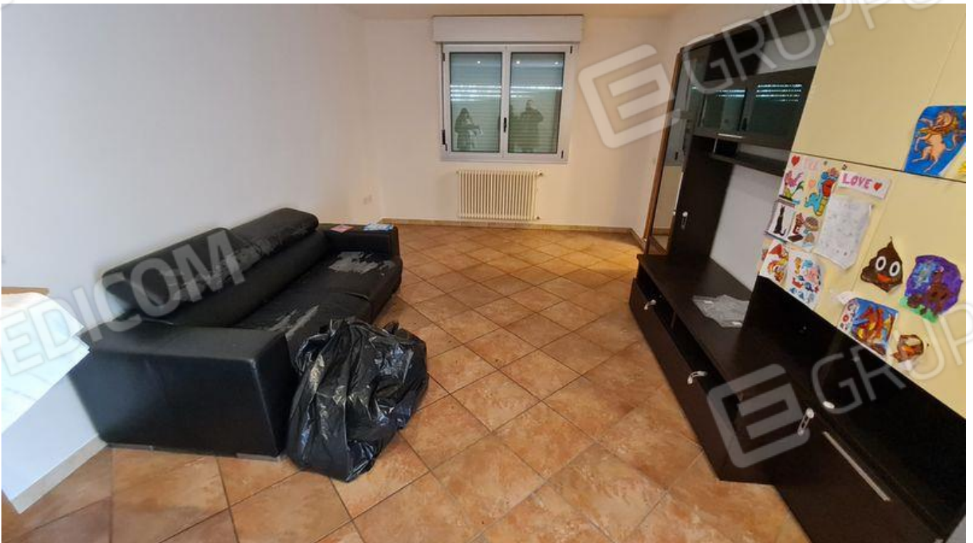
Zona giorno (P1)