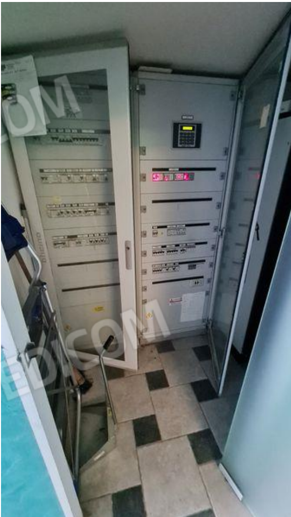
Locale contatori, ex ripostiglio (PT)