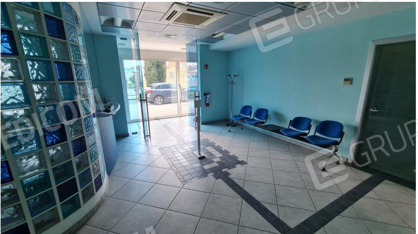
Ingresso con vista su ufficio (PT)