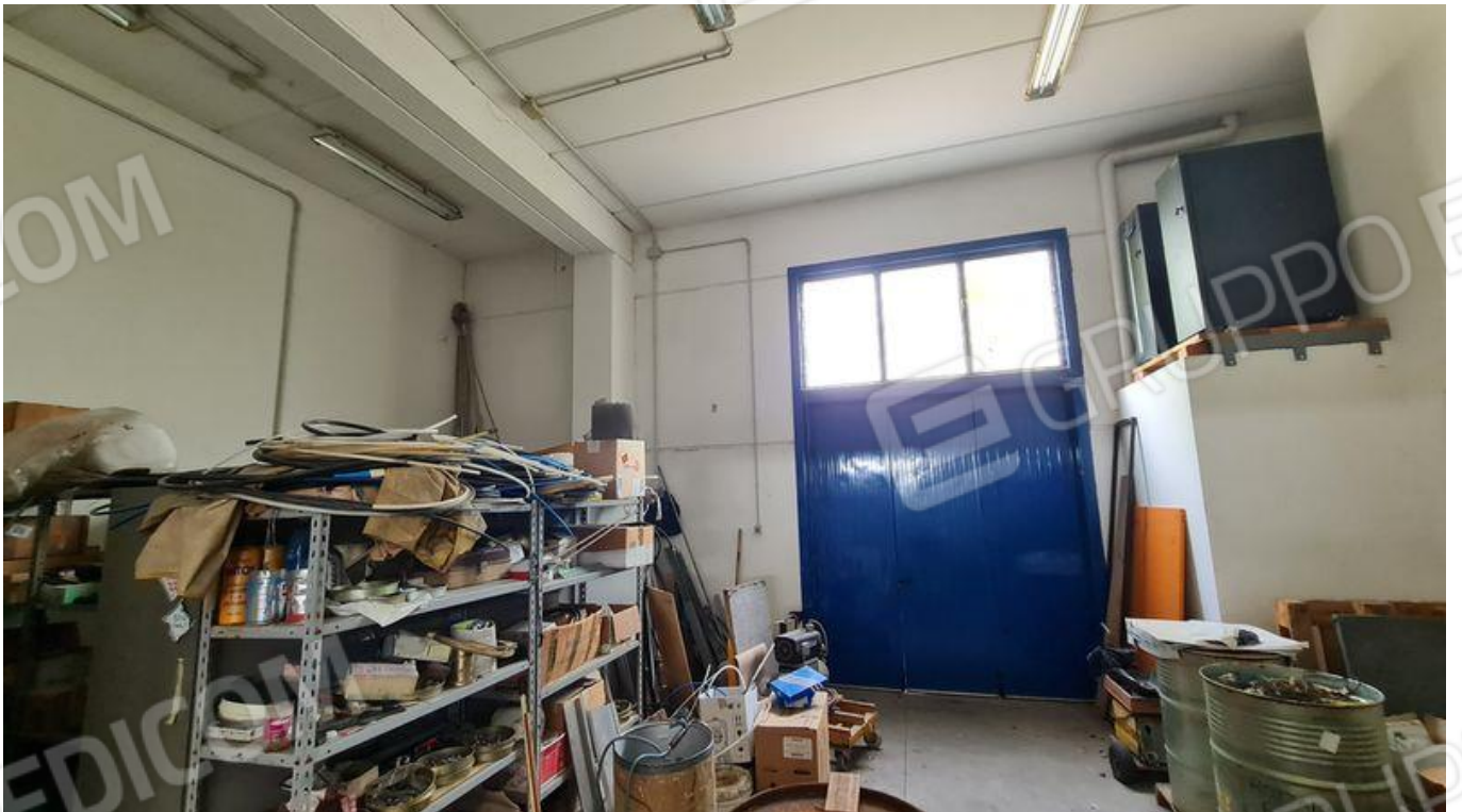
Locale di deposito ricambi e manutenzione (PT)