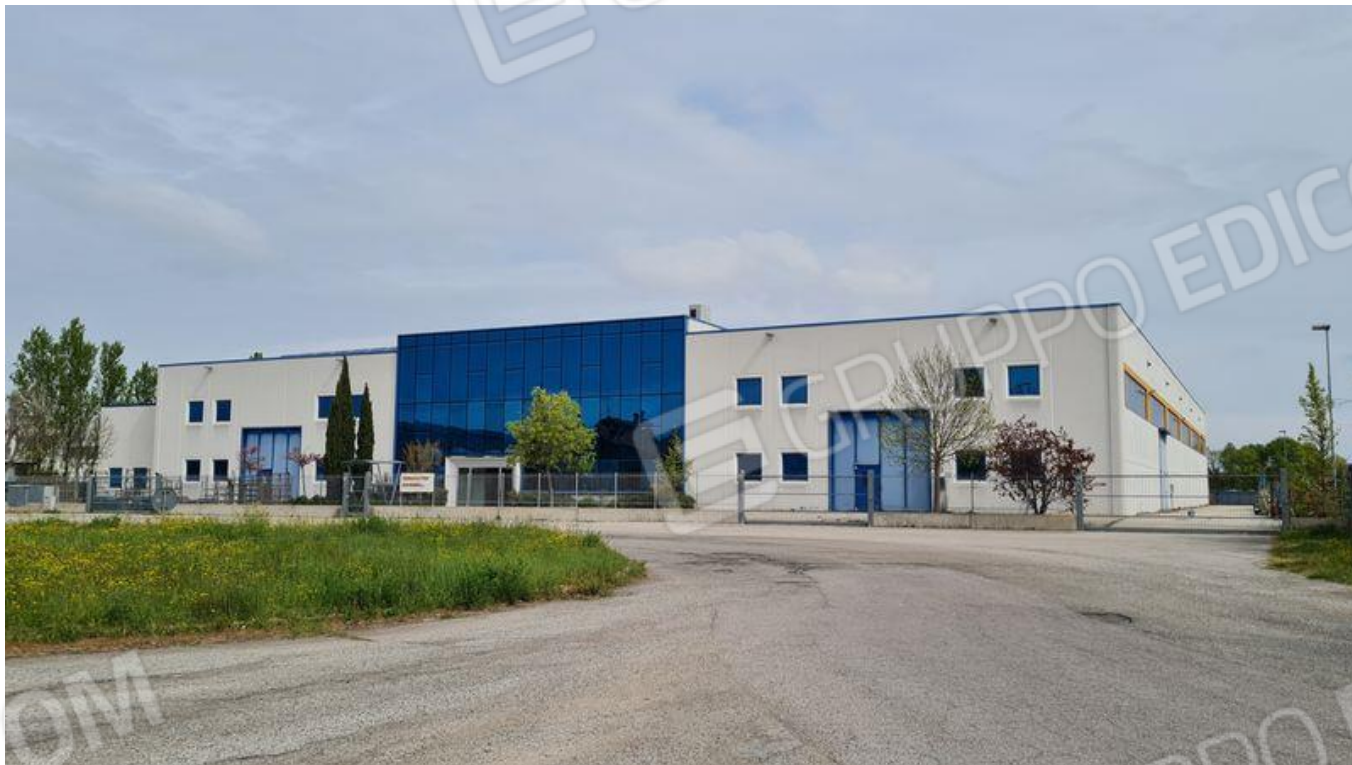
Vista dello stabile da via Bandoli