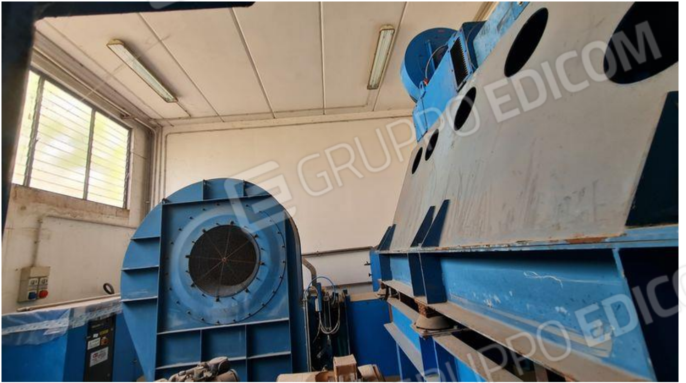
Locale compressori (PT)