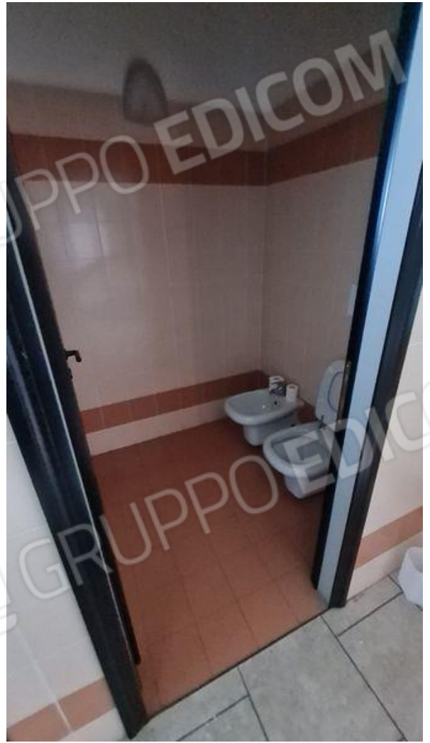
Bagno uomini (PT)