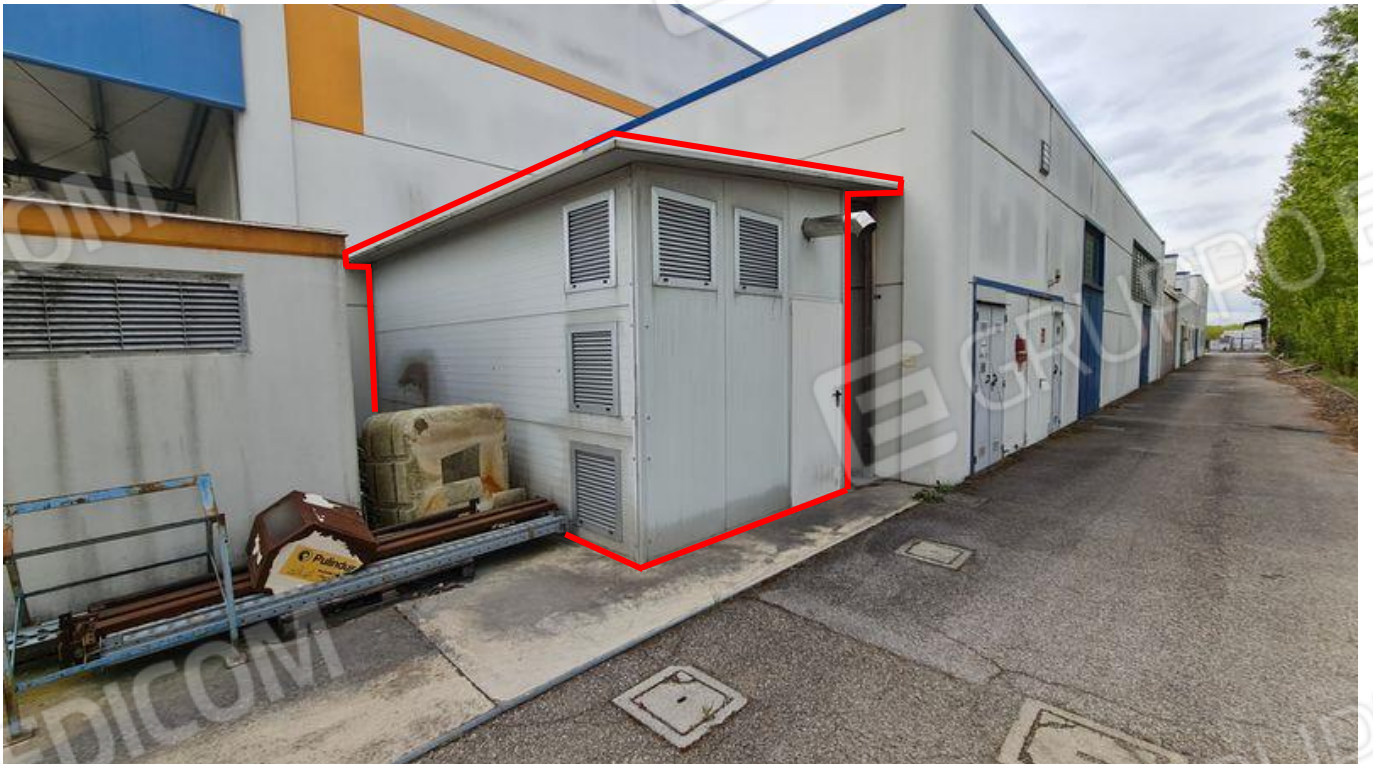
Forno HST (PT)