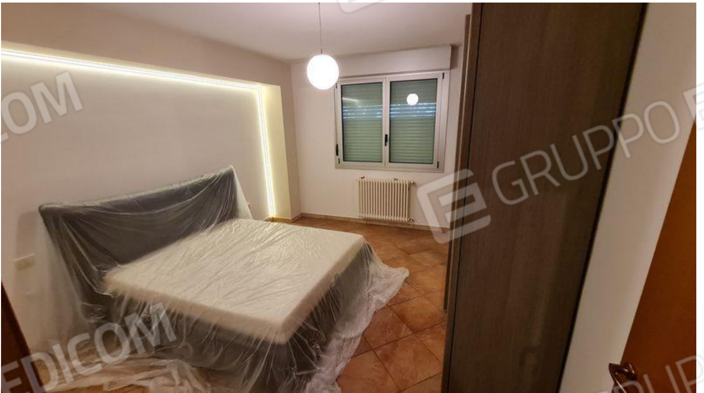
Camera da letto matrimoniale (P1)