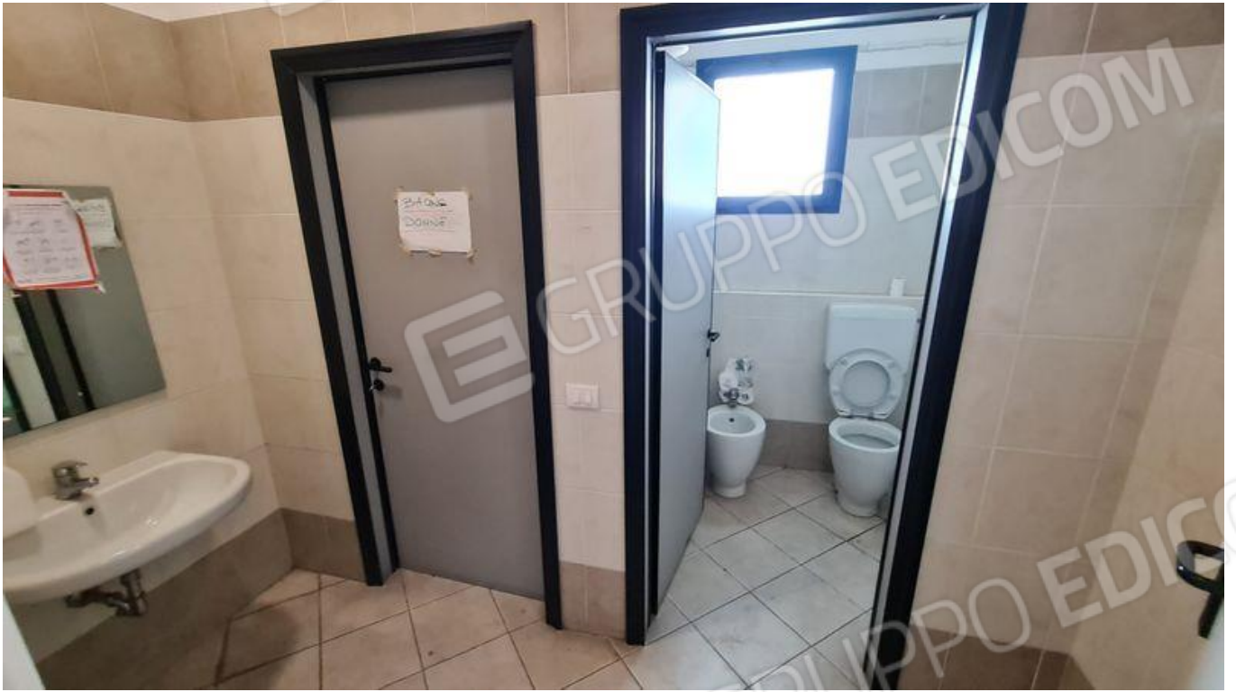
Bagni all'interno del capannone (PT)