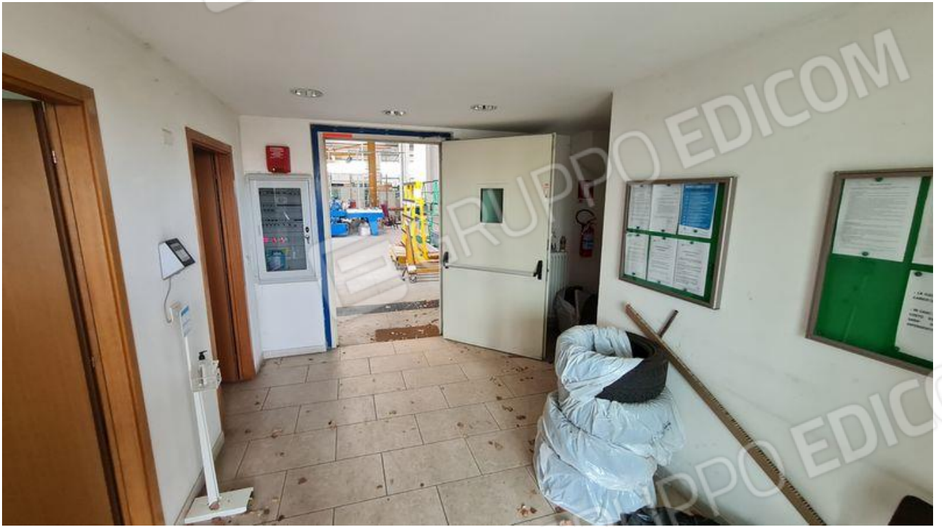
Ingresso operai alla zona spogliatoi, bagni, infermeria e mensa (PT)