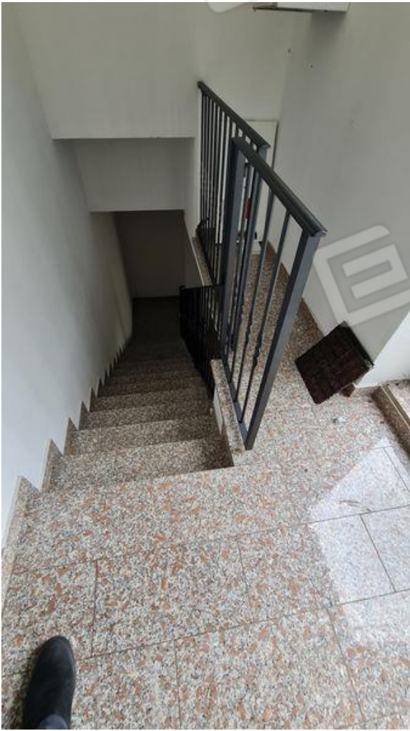
Vista scala da P1 che porta all'appartamento