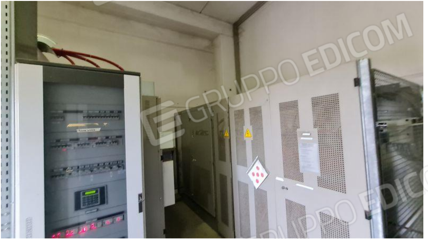
Locale enel con accesso esclusivo dall'esterno (PT)