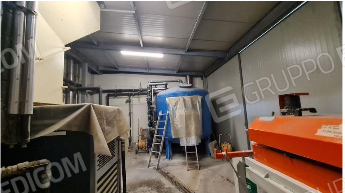
Locale depurazione (PT)-tamponamento e coperture realizzati senza titolo