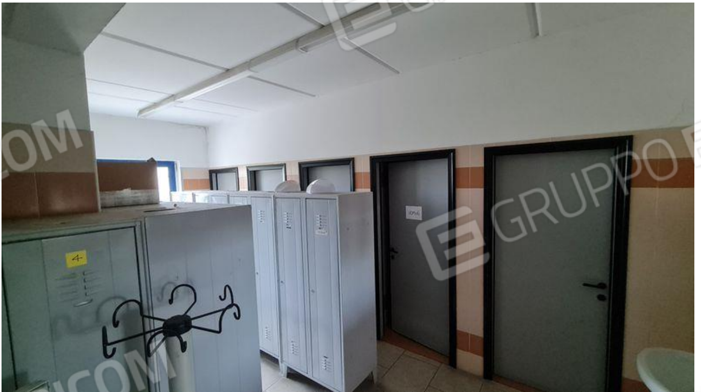
Spogliatoio uomini (PT)