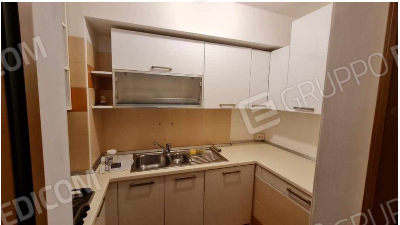
Cucina, ex ripostiglio (P1)