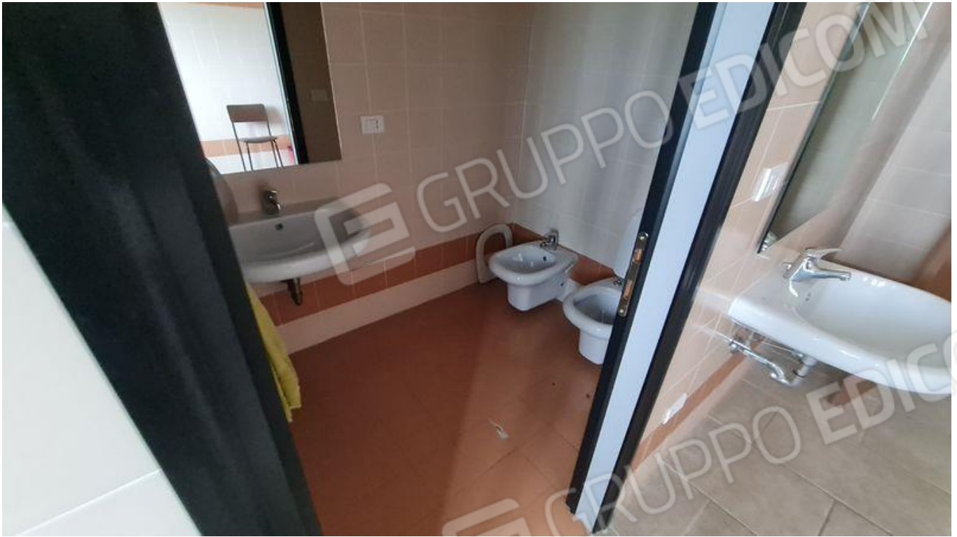
Bagno donne (PT)