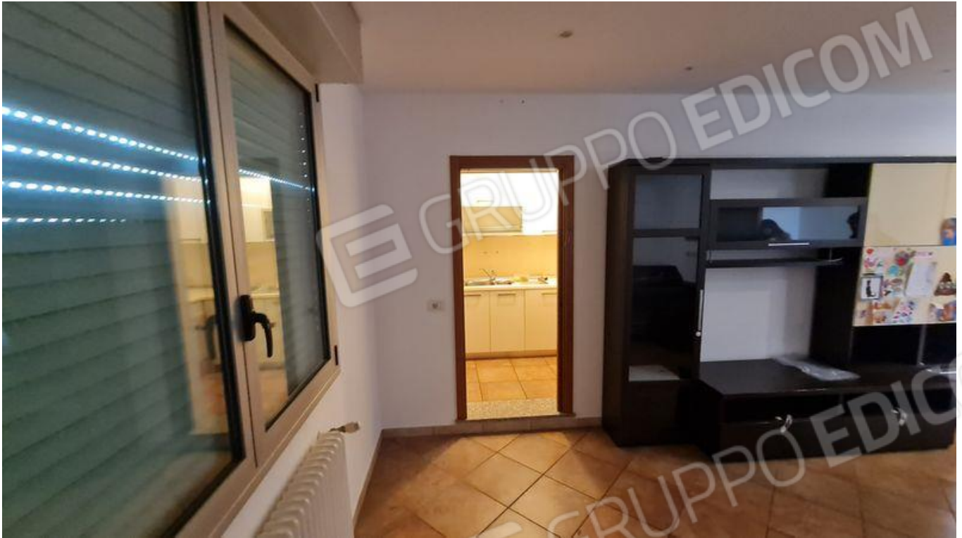
Zona giorno con vista su cucina (P1)