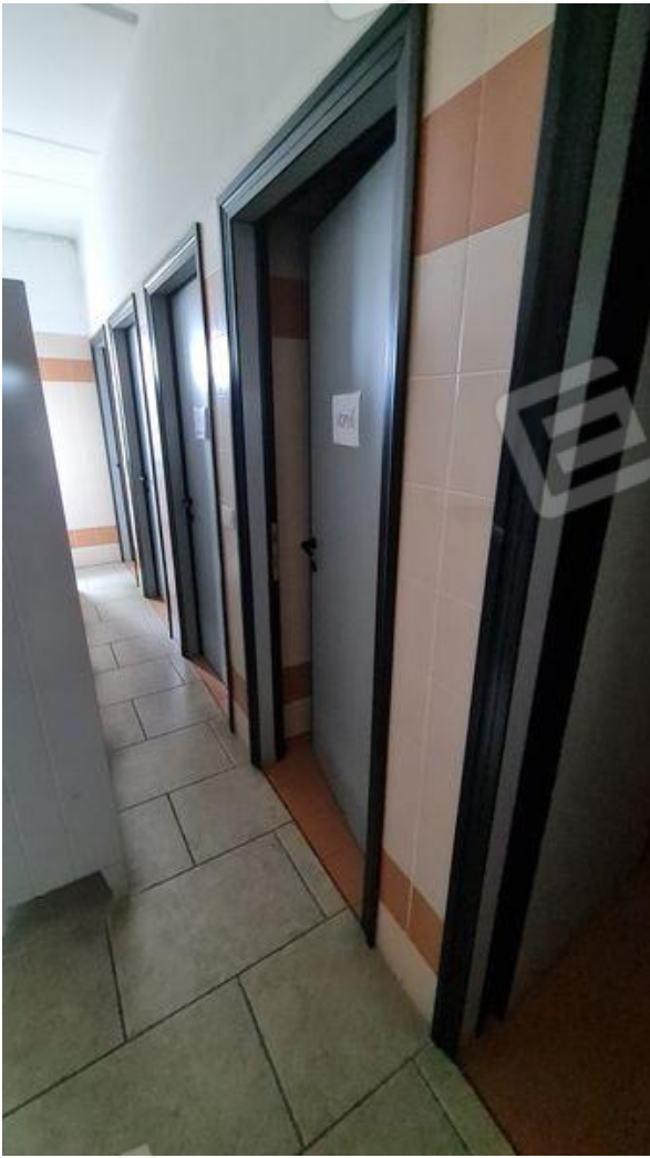
Bagni uomini (PT)