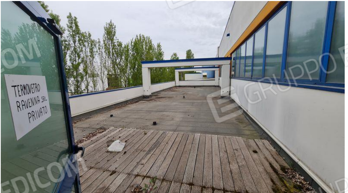
Copertura piana (P1)