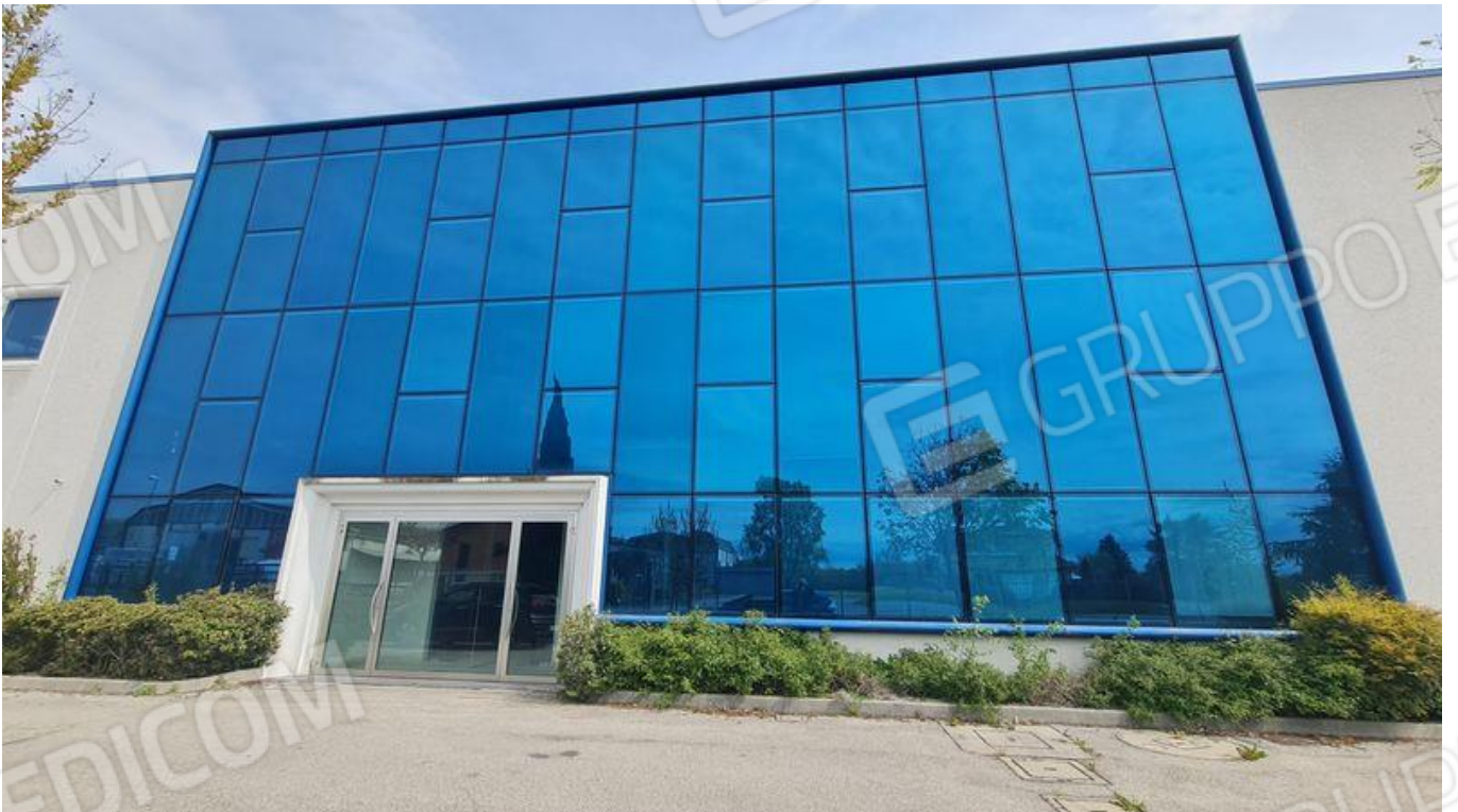
Focus vista su ingresso zona uffici da via Bandoli