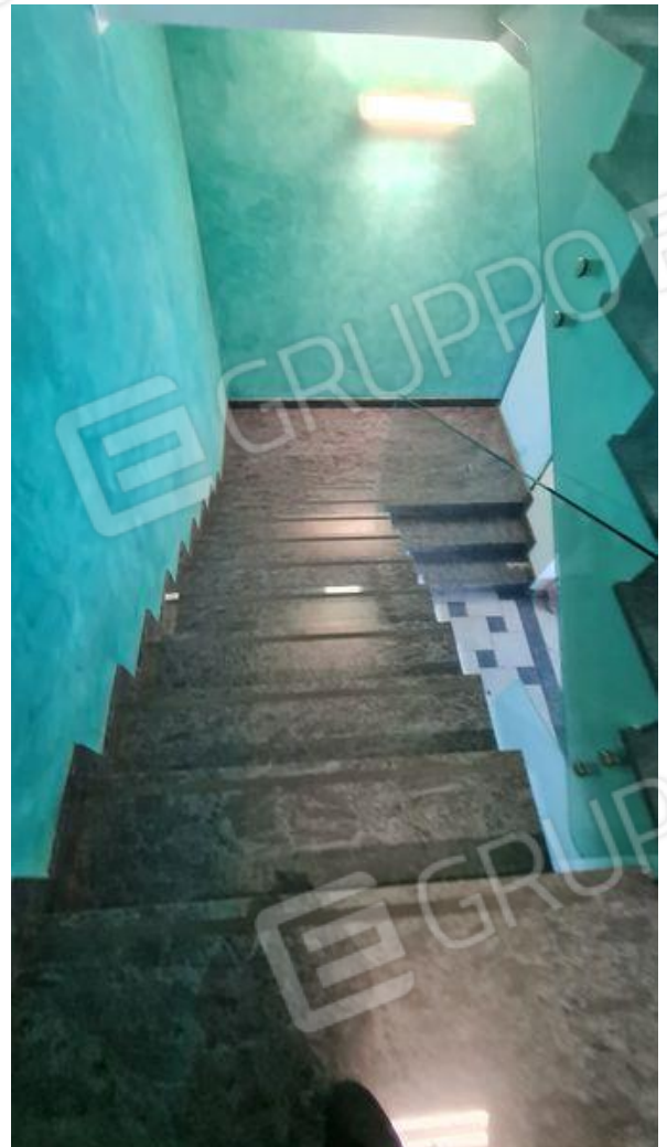
Scala che porta al P1 della zona uffici