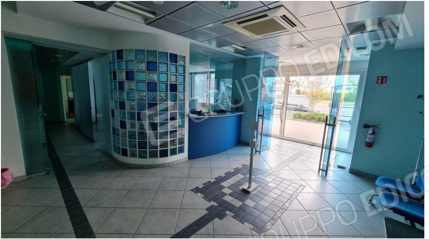
Ingresso zona uffici (PT)