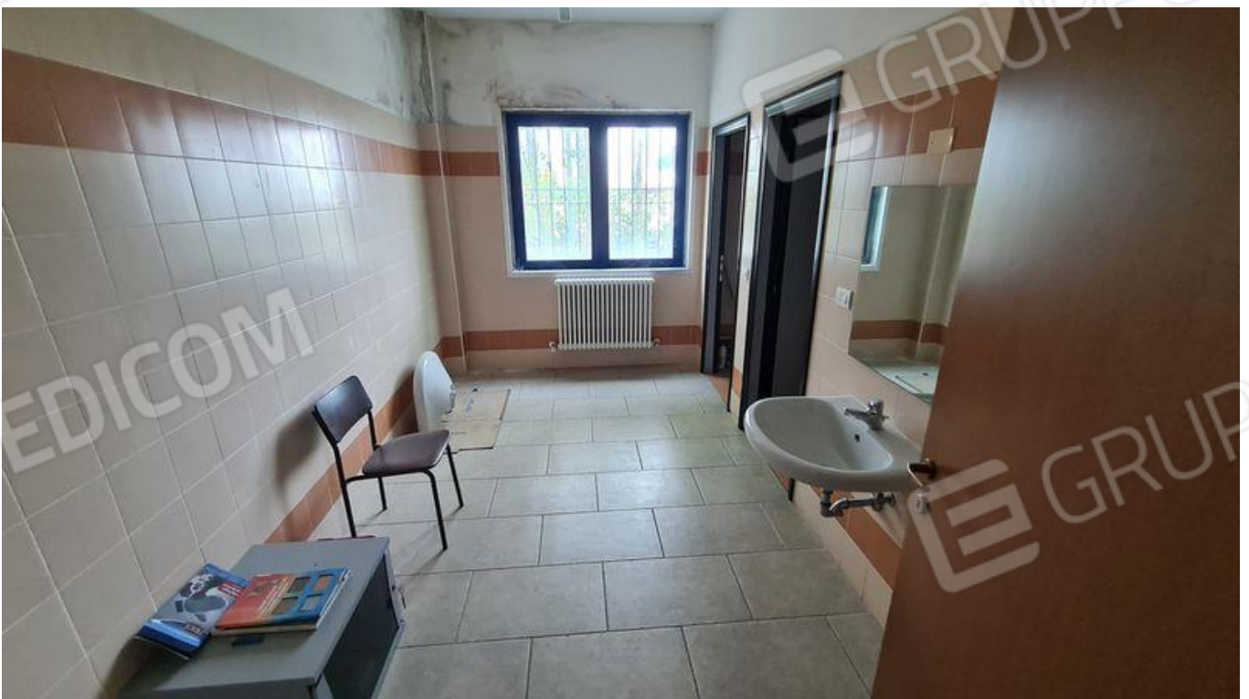
Spogliatoio donne, con vista su bagni (PT)