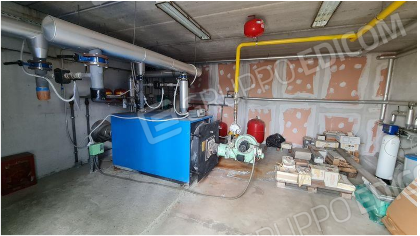
Centrale termica con accesso esclusivo dall'esterno (PT)