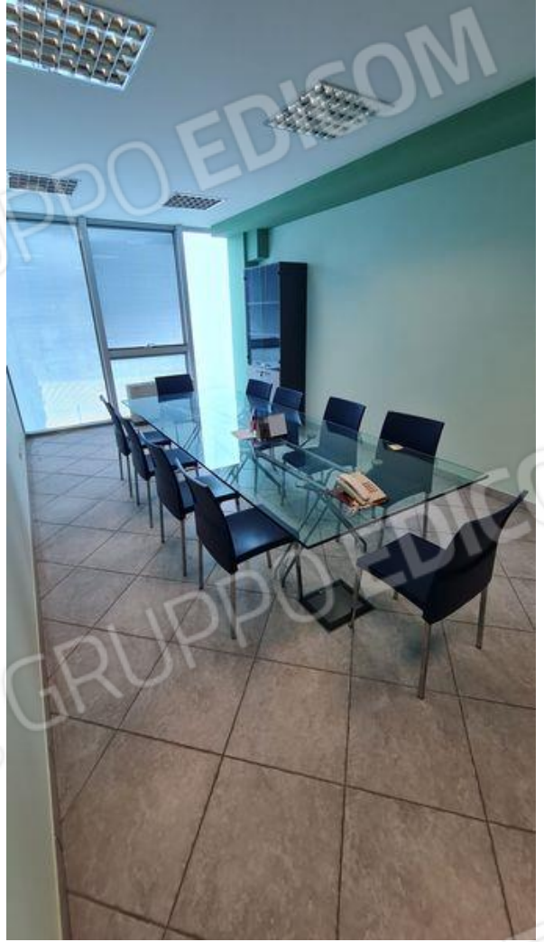
Sala riunioni (P1)