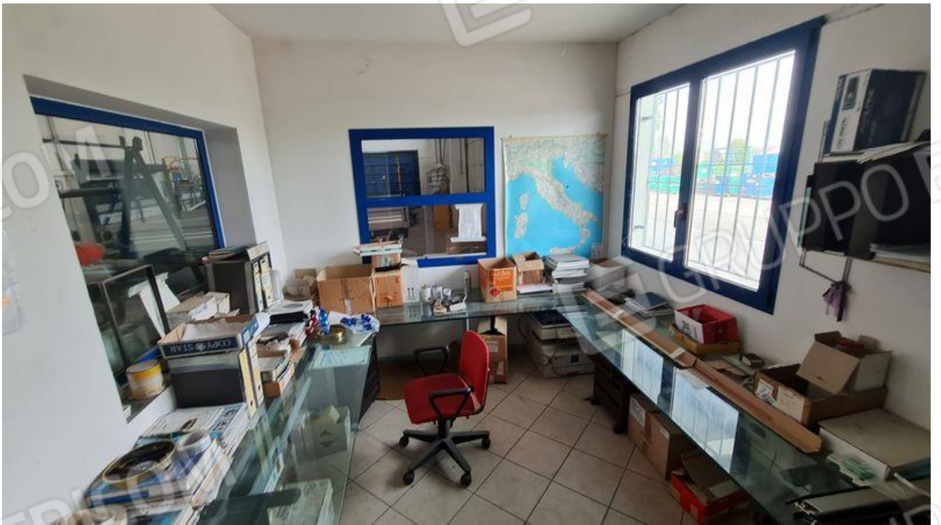
Ufficio all'interno del capannone (PT)