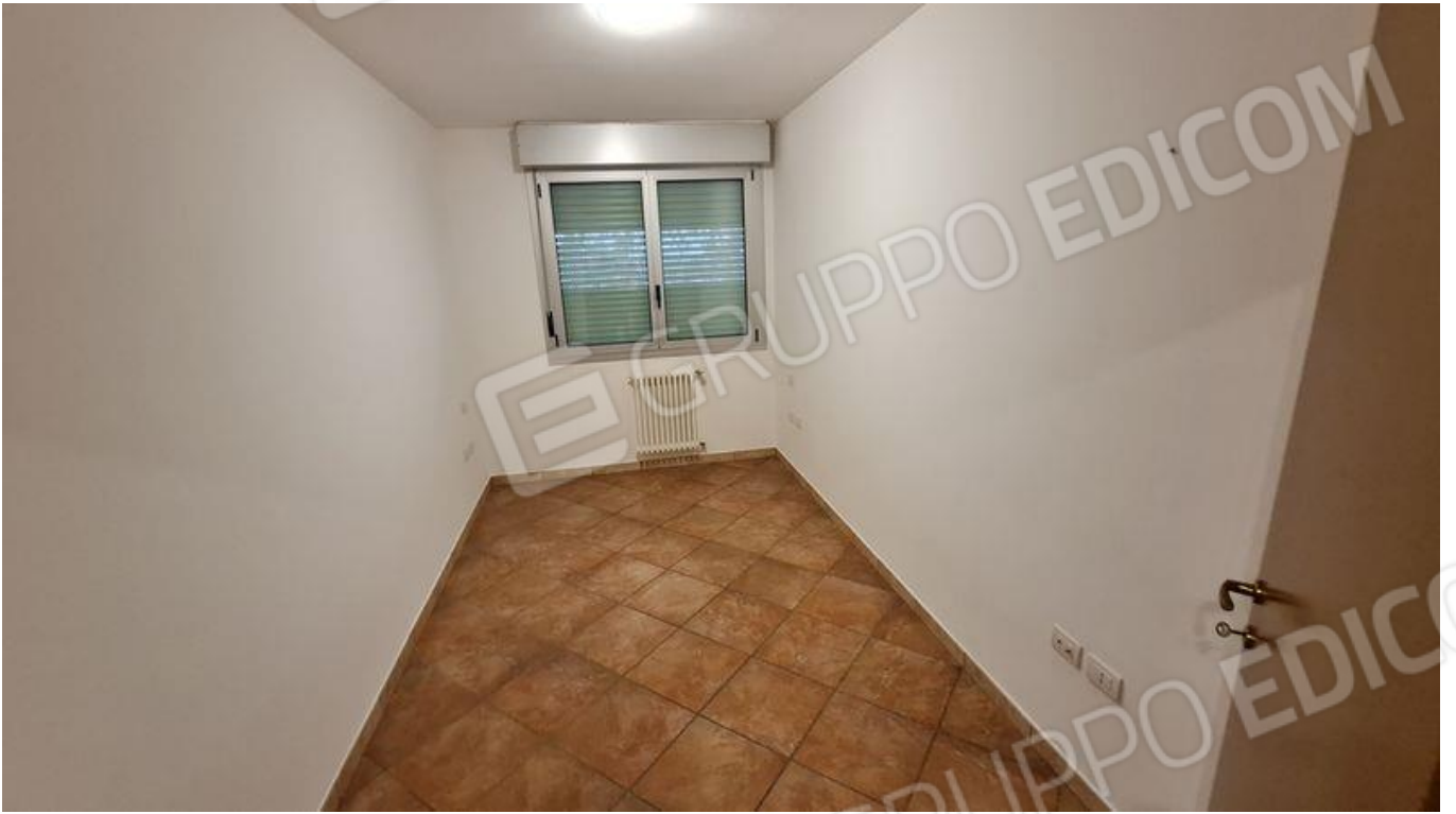
Camera da letto singola (P1)