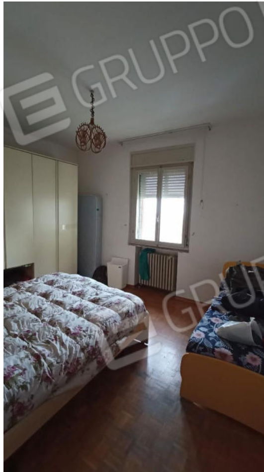
7.Seconda camera da letto Lato Ovest