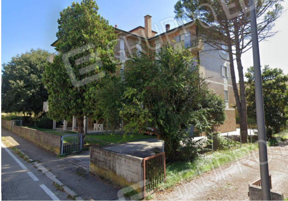
1 - Fronte principale edificio da Via Castelletto 3