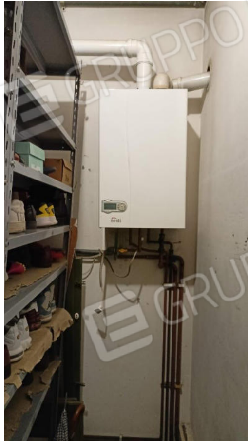
8. Locale Ripostiglio con caldaia