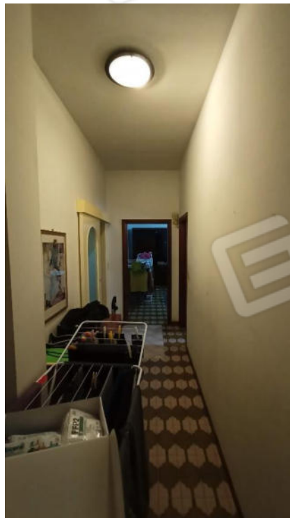
2- Corridoio Centrale abitazione