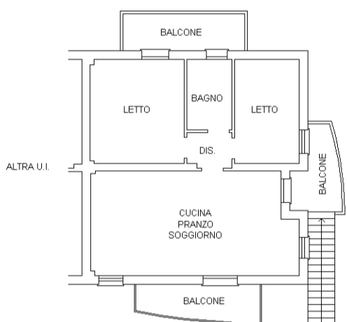
PIANTA PIANO PRIMO H 2.70