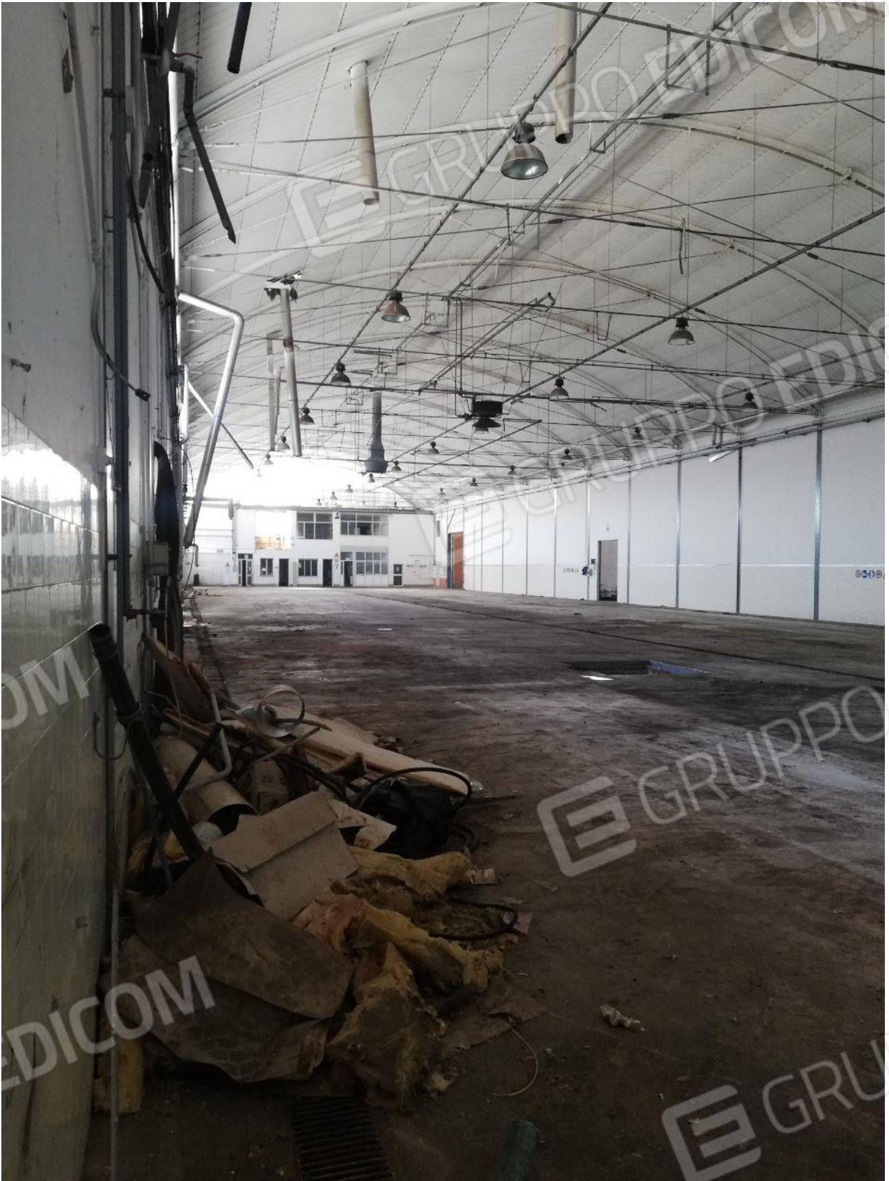
Figura 13 FOGLIO 103 MAPP. 257 SUB 6