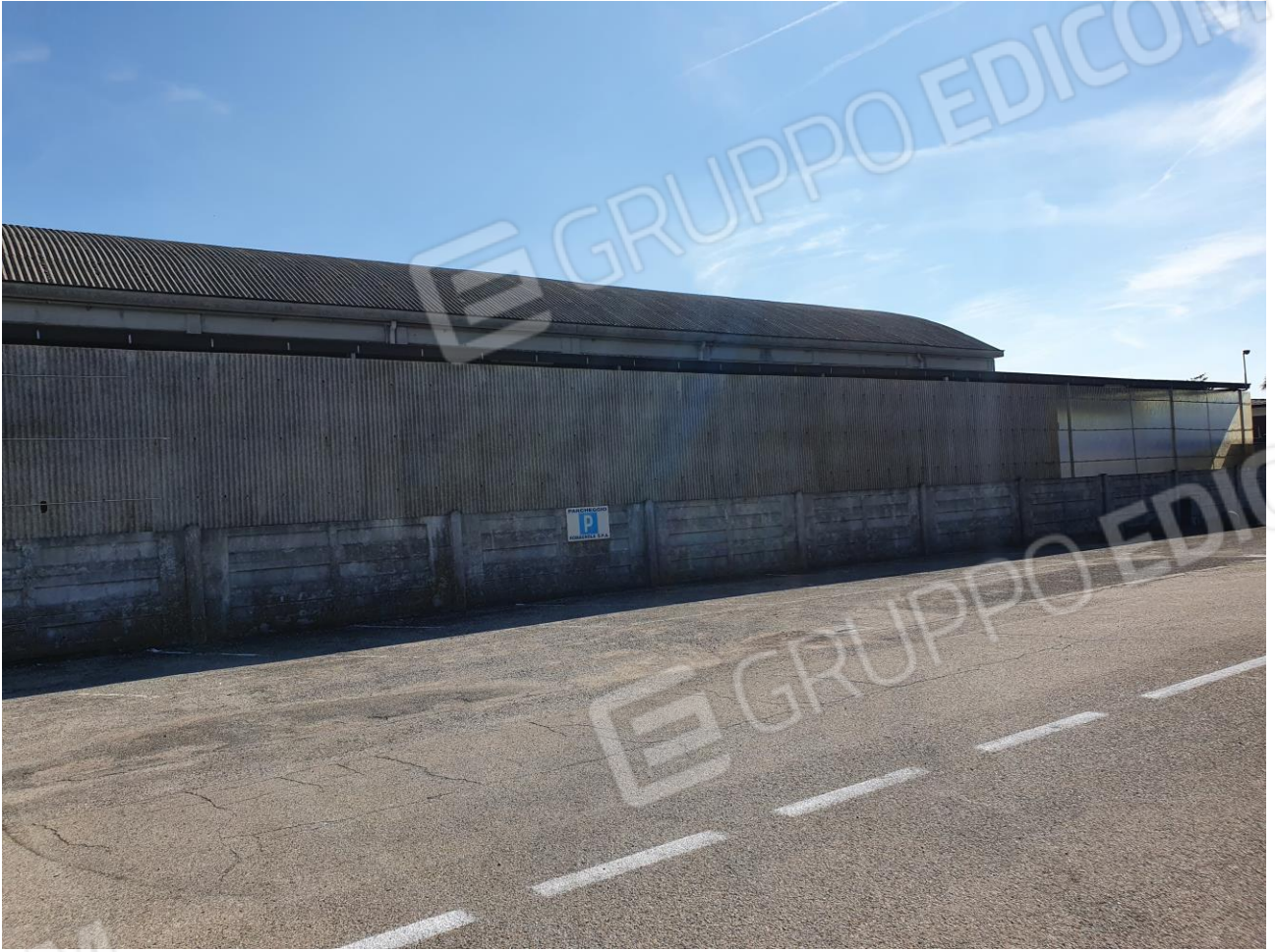
Figura 2 FIANCO FOGLIO 103 MAPP. 257 SUB 6/7