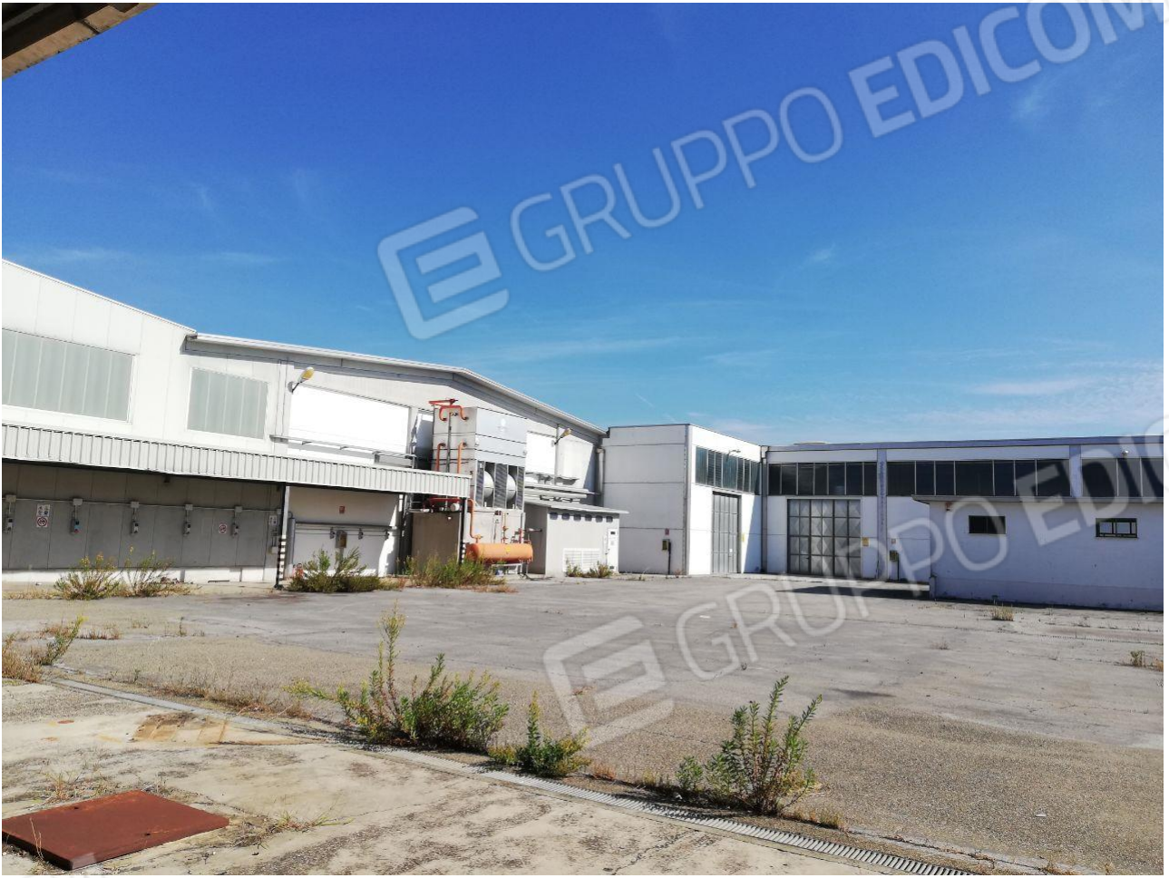
Figura 7 FOGLIO 103 MAPP. 257