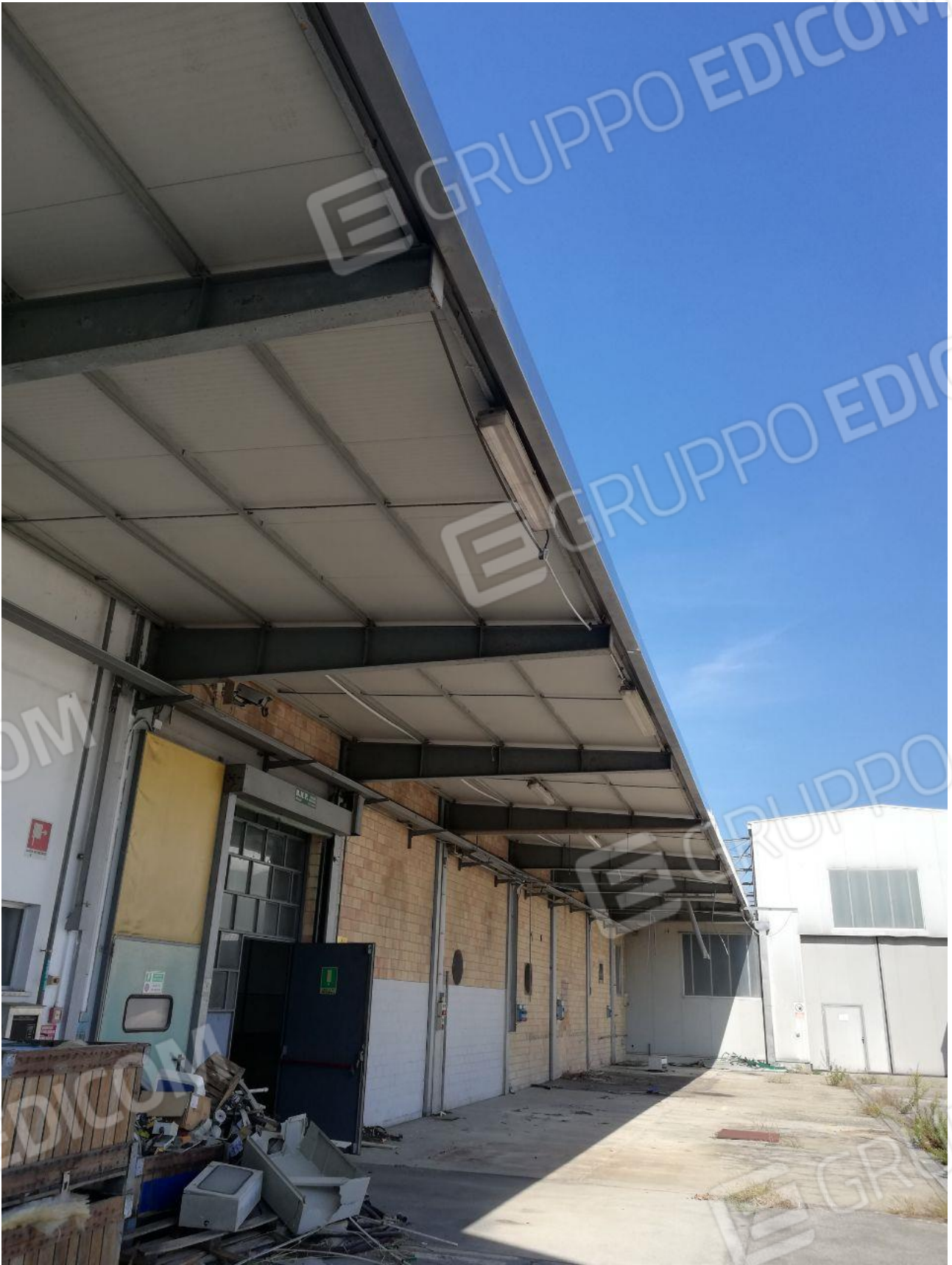
Figura 11 FOGLIO 103 MAPPALE 257