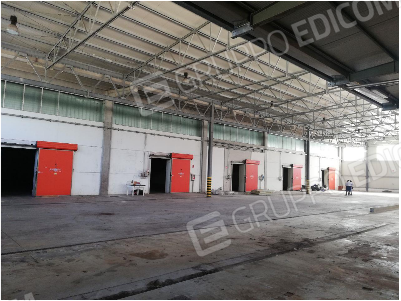
Figura 12 FOGLIO 103 MAPP. 257 SUB 4