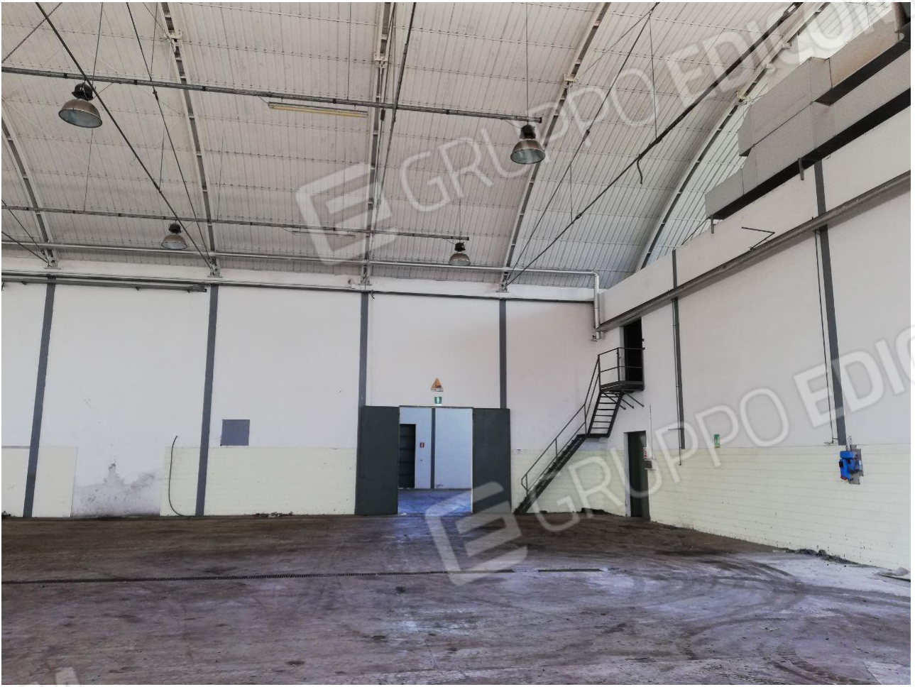
Figura 14 FOGLIO 103 MAPP 257 SUB 6