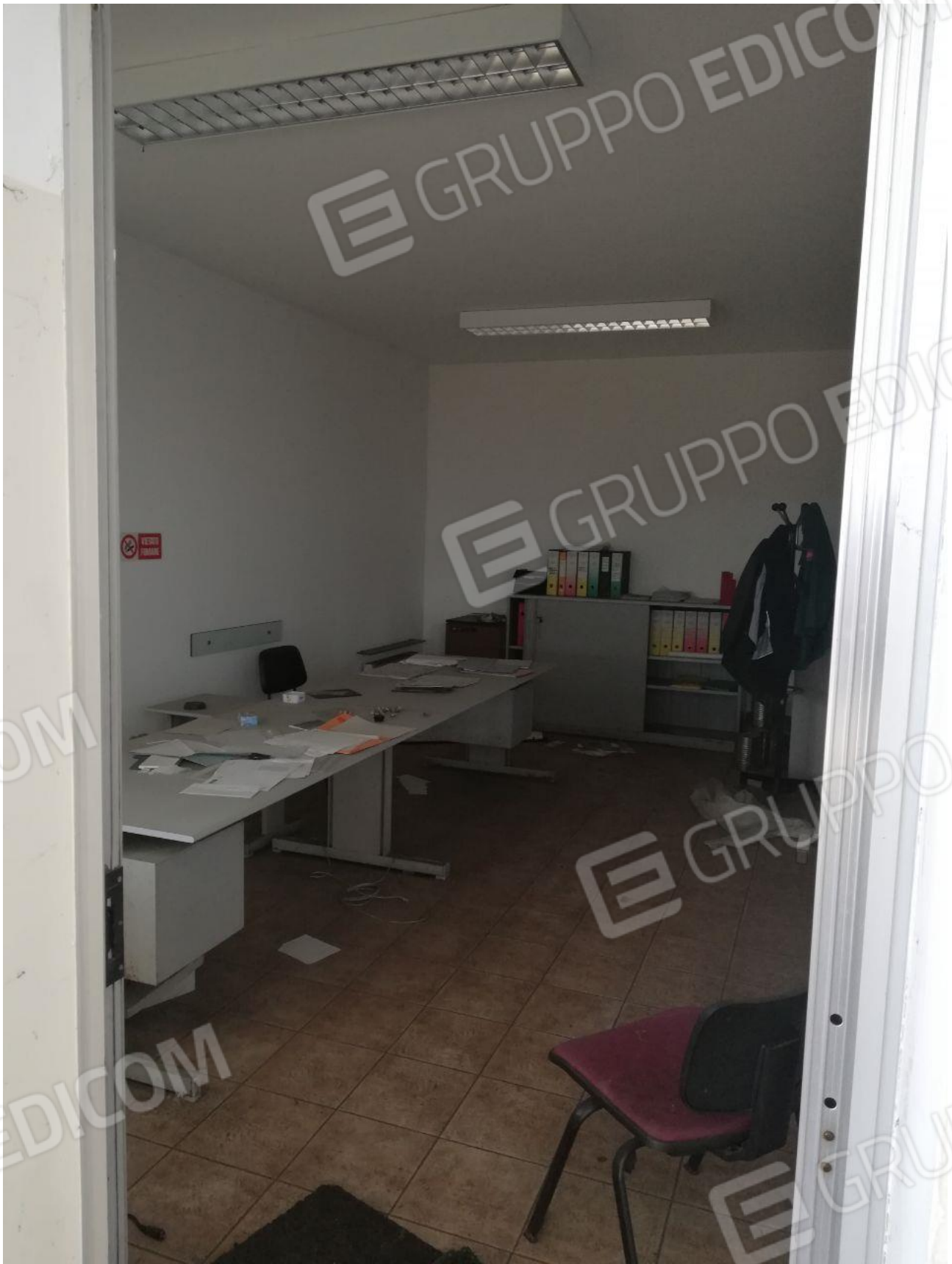
Figura 6 INTERNO FOGLIO 103 MAPP. 257 SUB 7