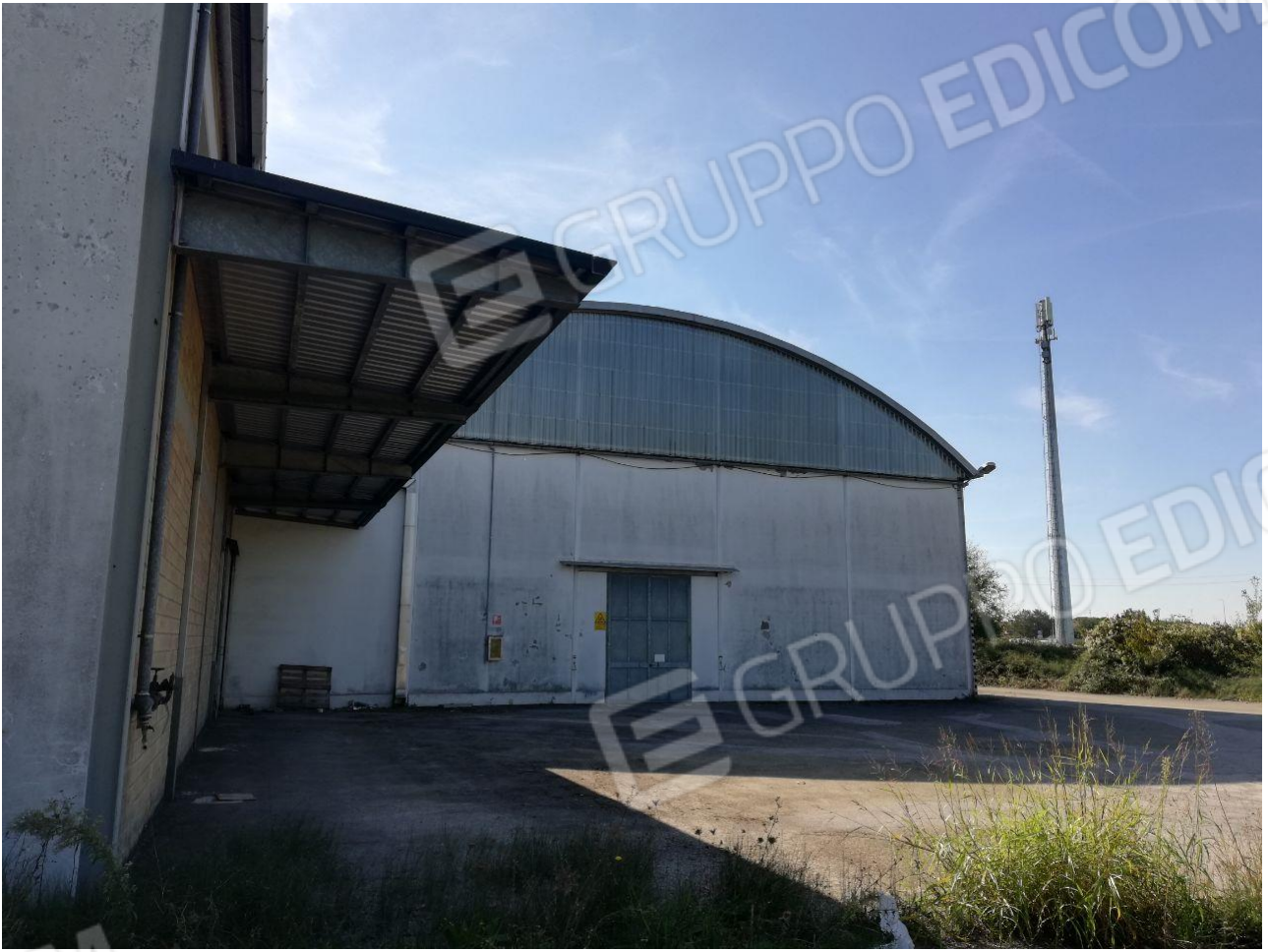
Figura 15 FOGLIO 103 MAPP. 257