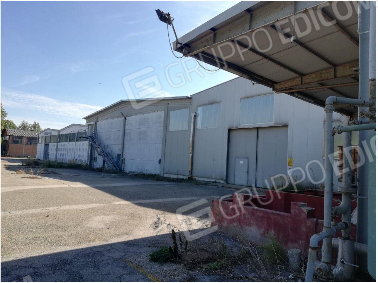
Figura 16 FOGLIO 103 MAPP. 257