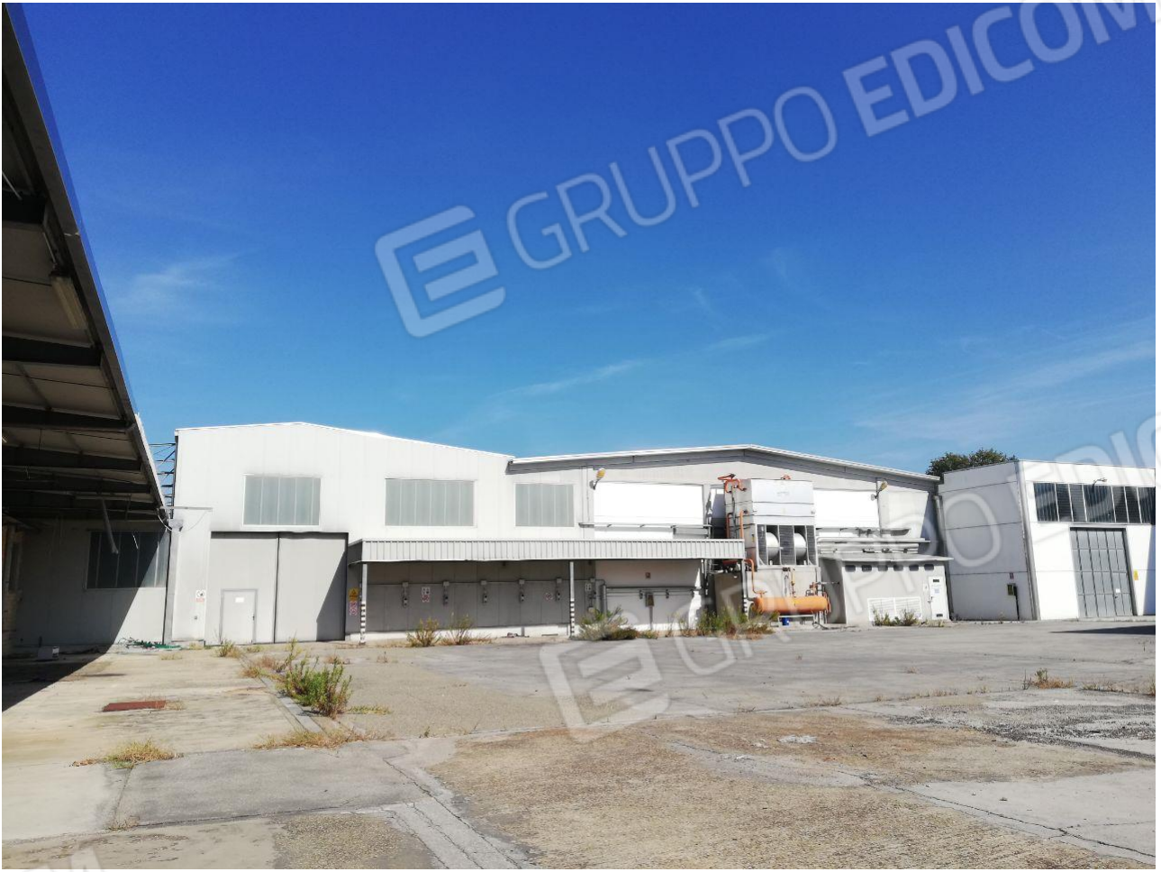
Figura 9 FOGLIO 103 MAPP. 257