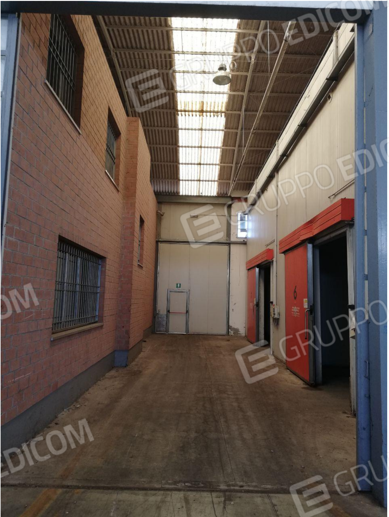
Figura 8 FOGLIO 103 MAPP. 257 SUB 6 CAPANNONE