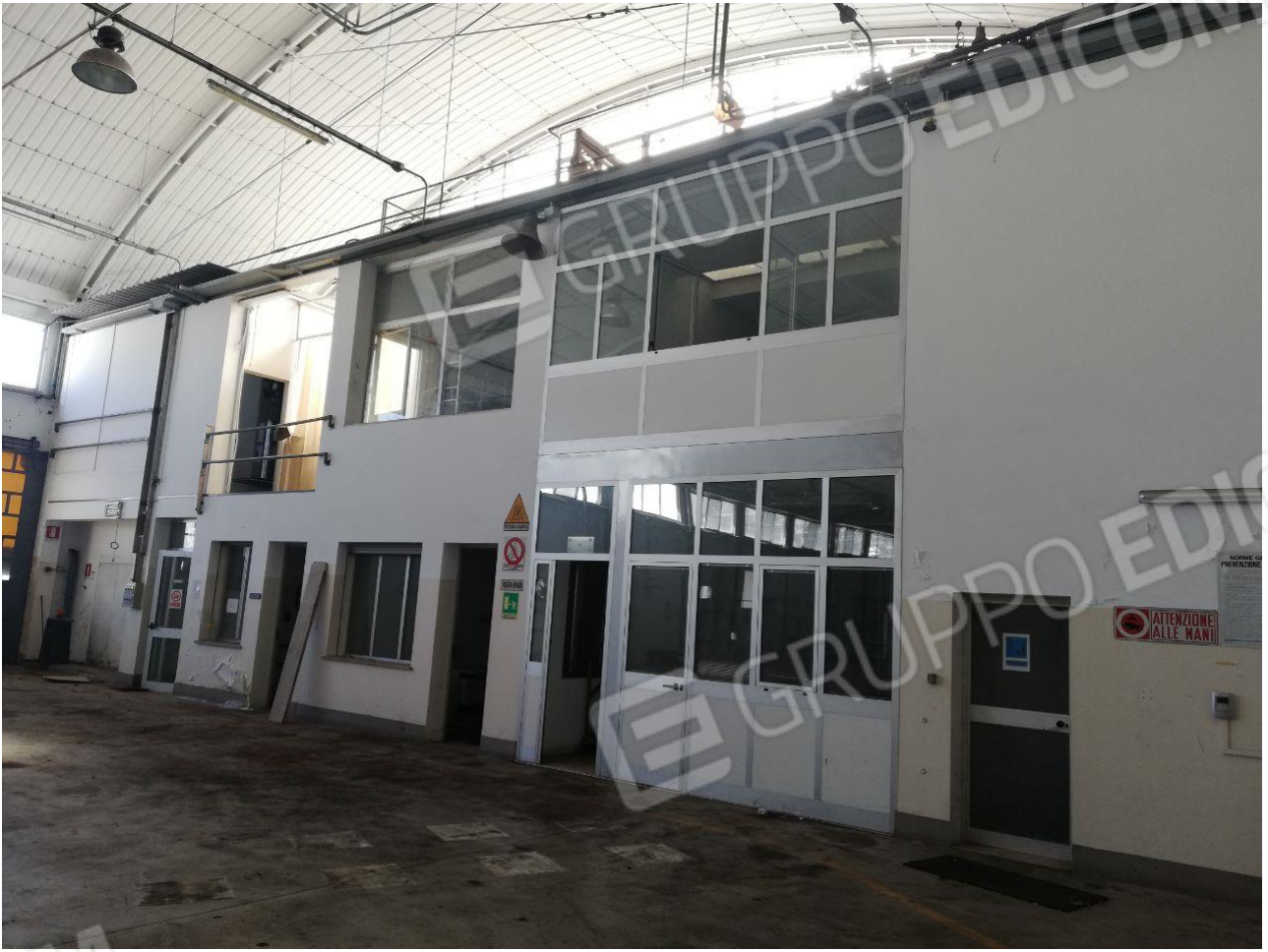
Figura 5 INTERNO FOGLIO 103 MAPP. 257 SUB 6 E VISAT SUB 7