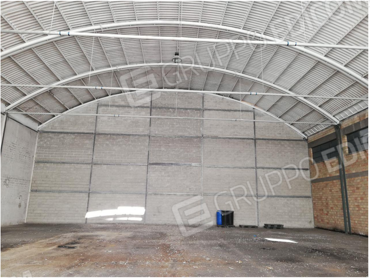
Figura 18 FOGLIO 103 MAPP. 257 SUB 7