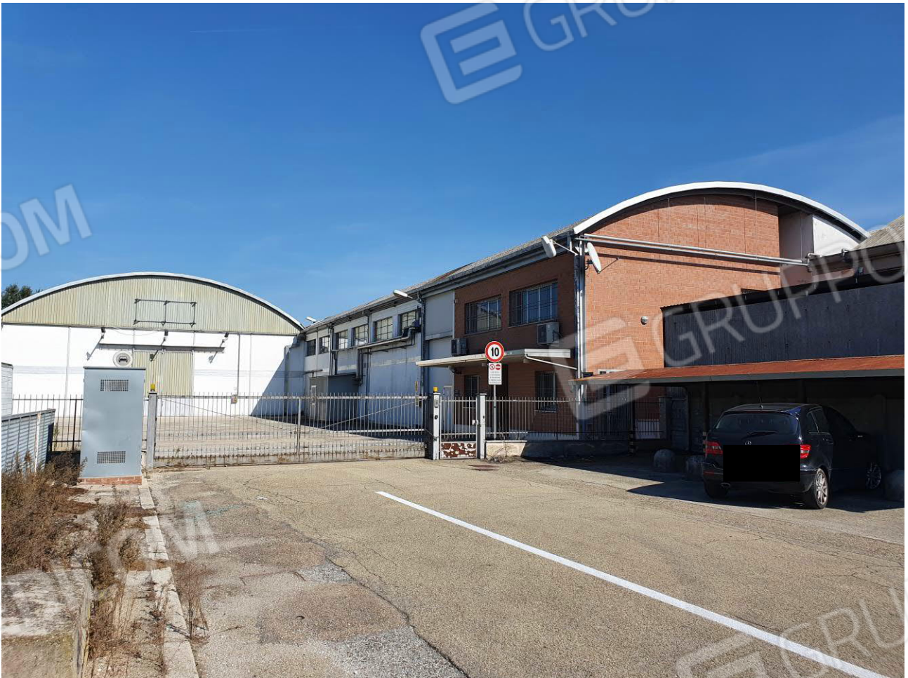
Figura 1 IL MAPPALE 257