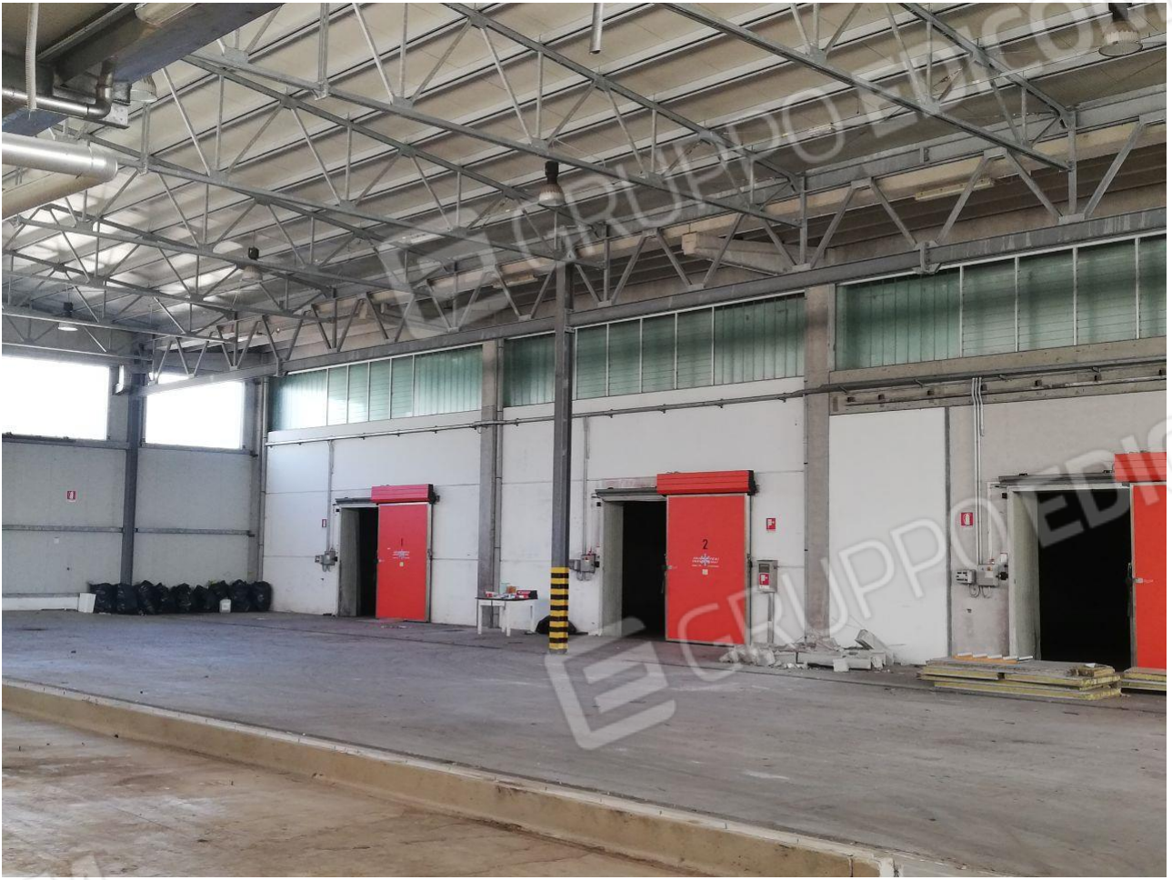
Figura 10 FOGLIO 103 MAPP. 257 SUB 4