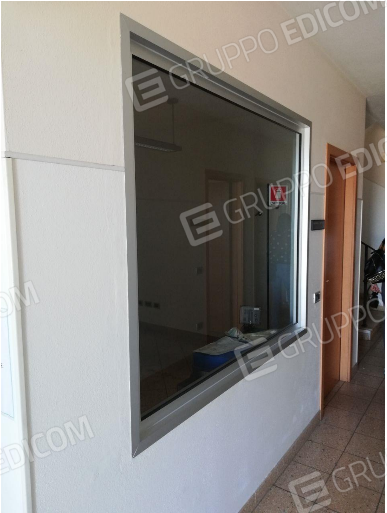
Figura 3 INTERNO FOGLIO 103 MAPP. 257 SUB 7 PT