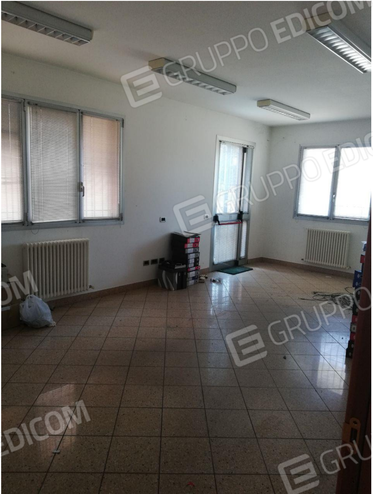
Figura 4 INTERNO FOGLIO 103 MAPP. 257 SUB 7 PT