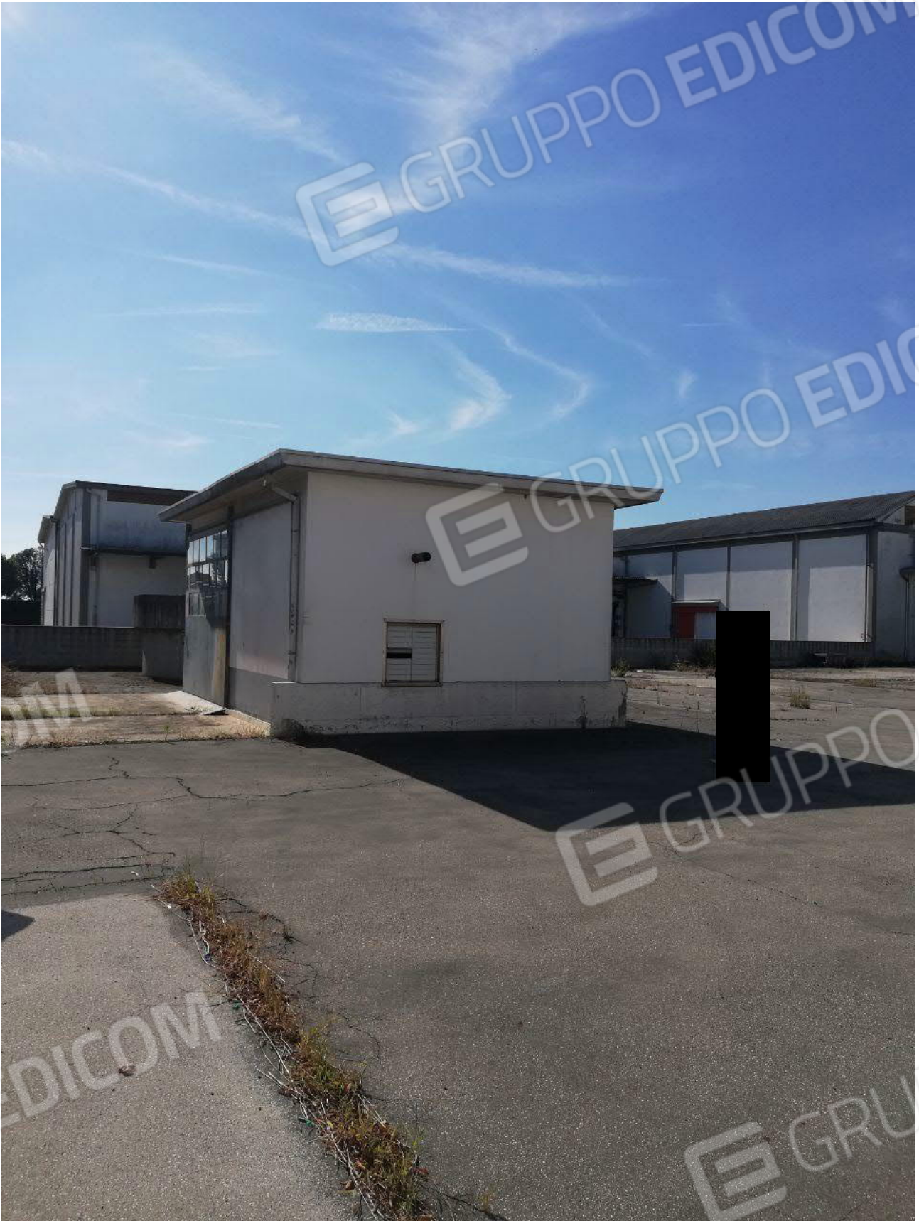
Figura 17 GRUPPO ELETTROGENO